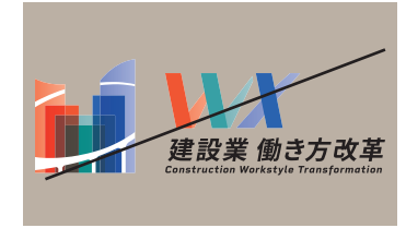
他の要素を加える