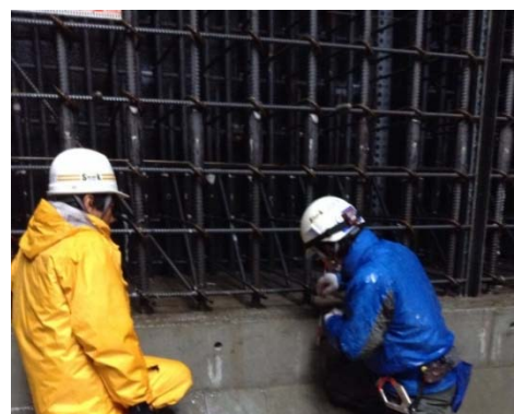
電子小黑板を写し込んだ工事写真(右)