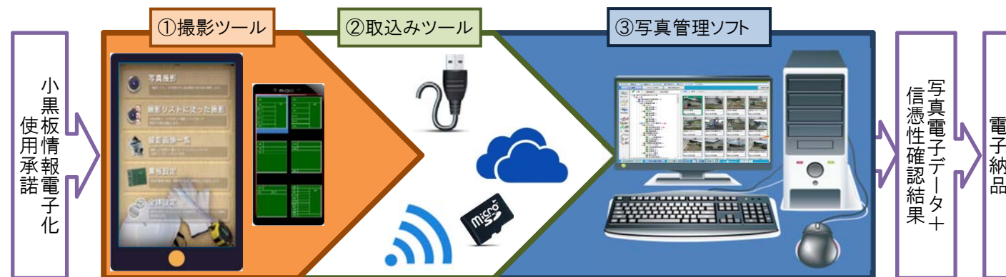
図-1.電子小黑板活用に必要なツールやソフトウェアの概念図