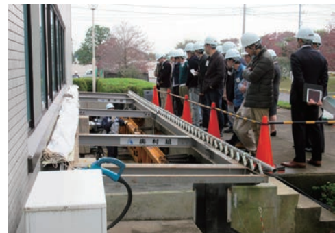
技術研究所の見学会