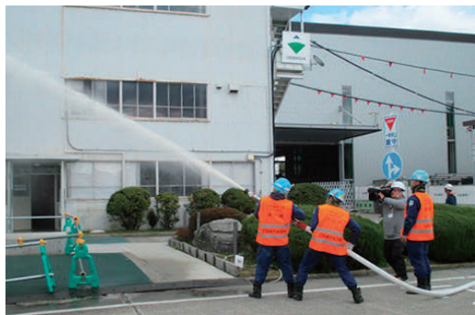
機械工場を消防訓練会場として提供