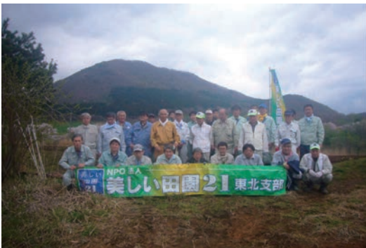
耕作放棄地解消支援活動