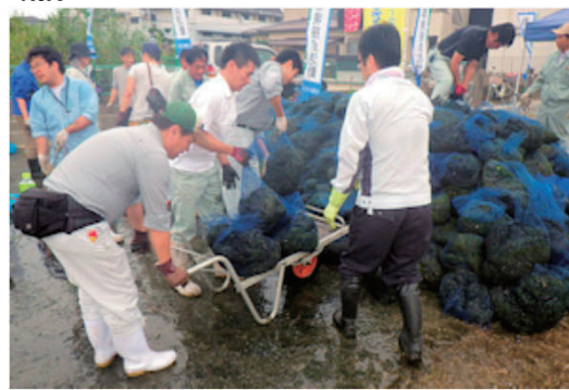
「あおさ」の清掃活動の実施