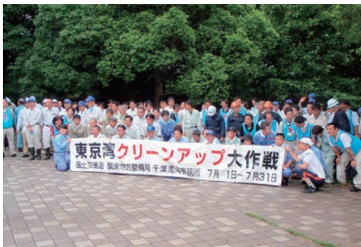
東京湾クリーンアップ大作戦