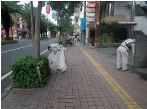
88クリーンウオーク四国