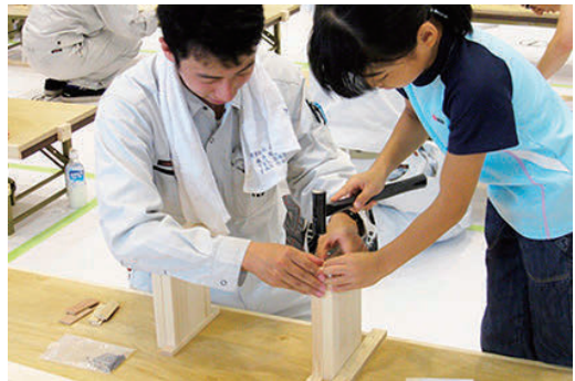
親子木工教室を開催