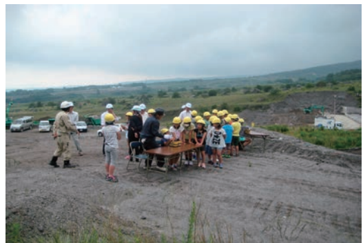
小学生の現場体験学習