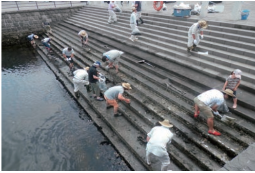
みなとみどりサポーター