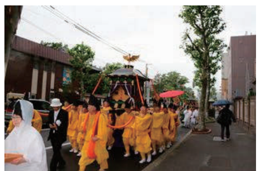
札幌まつり 神輿渡御