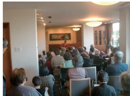
奈良学園前アートフェスタ