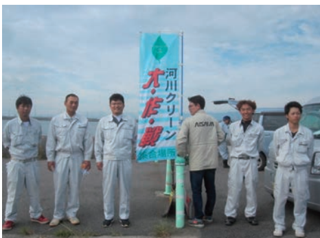
海と川のクリーン大作戦