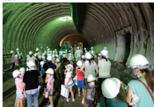
現場見学会を開催