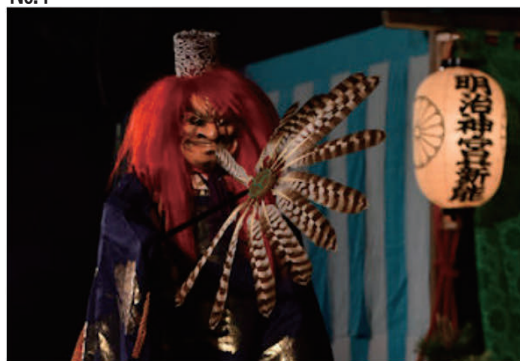
「第35回明治神宮新能」奉納協賛