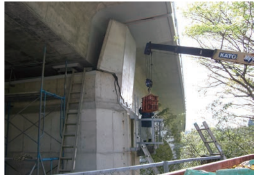
災害救援活動（熊本大分地震）