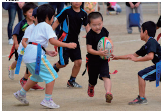
気仙沼でタグラグビー大会を開催