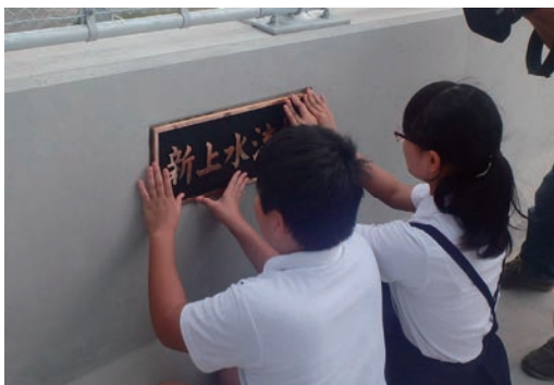
地元小学生との橋名板取付式