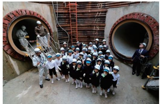
安全・安心・便利な街