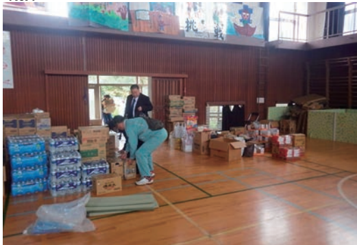
熊本地震被災者へ支援物資の搬入