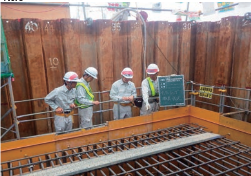
インターンシップの実施