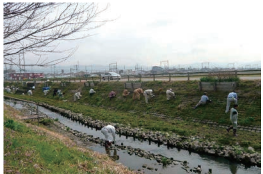
巨椋池干拓地の清掃活動