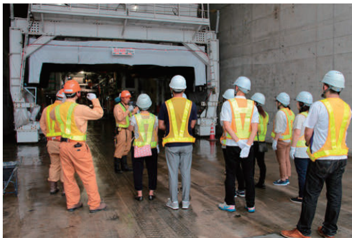
教員の民間企業研修の受け入れ