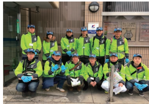
「奈良マラソン」の運営協力