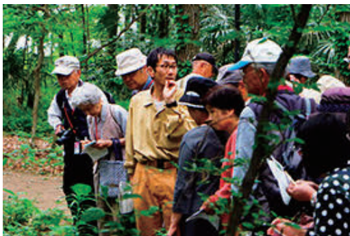
キンランの観察会