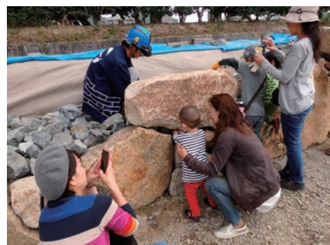
ミズベリング岡山旭川