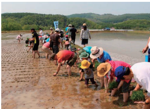
緑の水田プロジェクト