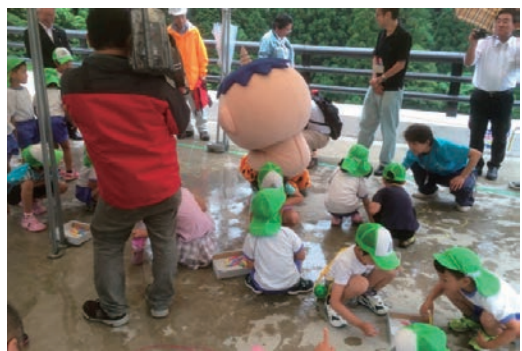
若桜学園児童のお絵かき会