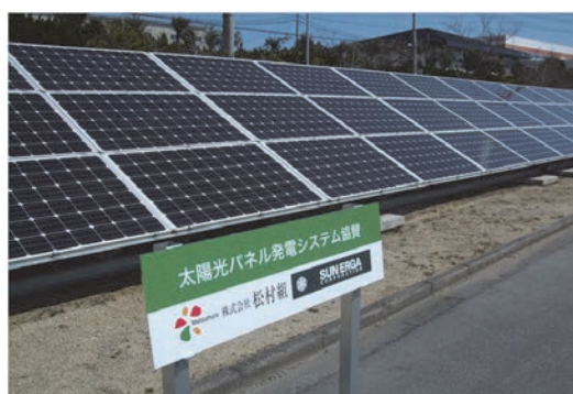
太陽光パネルの提供