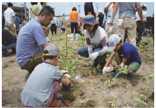
ひまわりプロジェクト2015