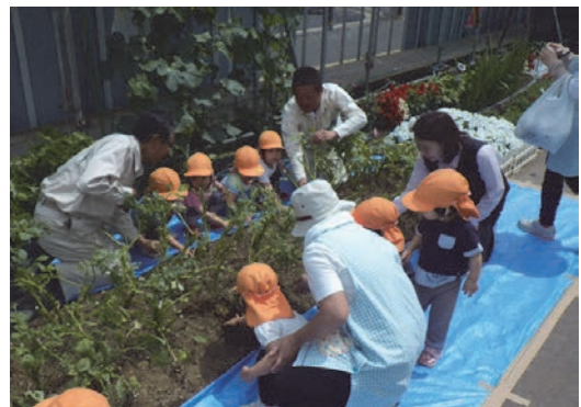
現場内に作った畑で芋ほり