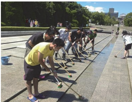
「平和の池」清掃活動に参加