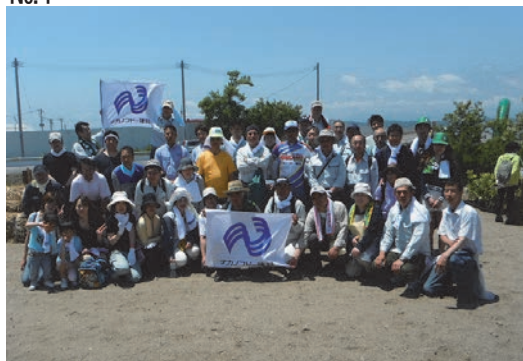
千年希望の丘植樹祭