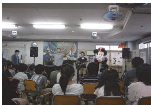
児童養護施設でのイベント