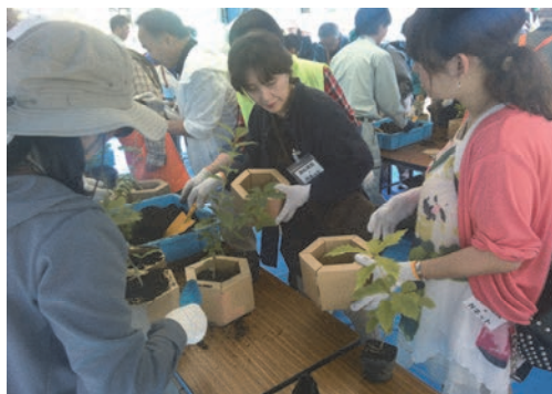
札幌水源の森づくり2015