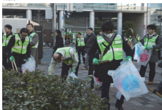
芝地区クリーンキャンペーン