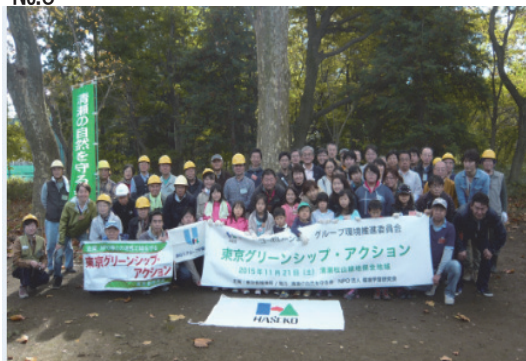
東京グリーンシップ・アクション