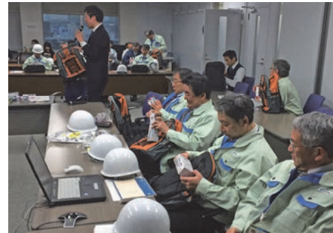
非常用備蓄品の体験会