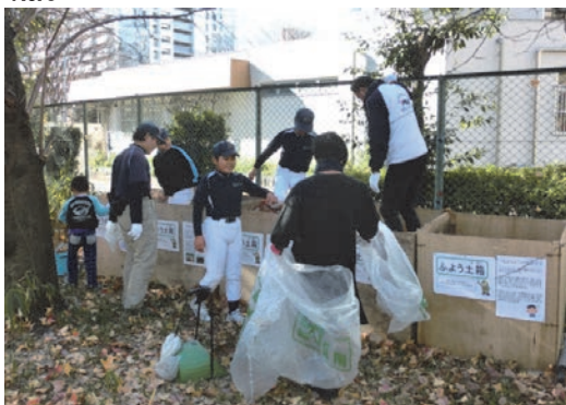
小学生とともに腐葉土づくり