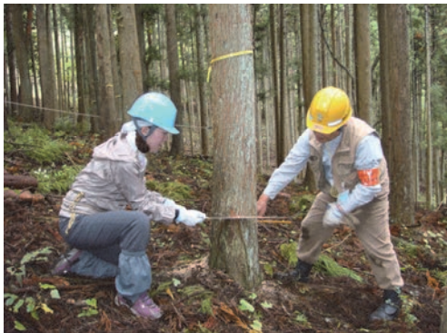
水源林の間伐ボランティア活動