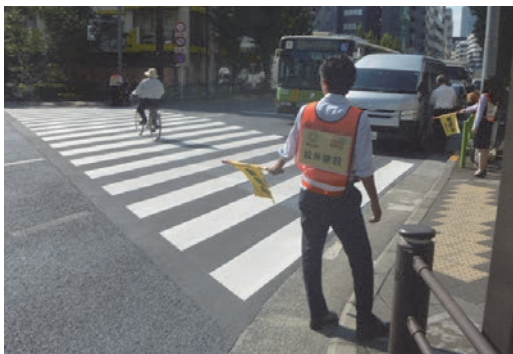
全国交通安全運動への協力