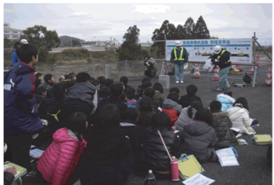
小学校の校外学習会への社員派遣