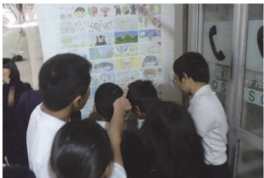
小学生作成タイル設置～湯浦トンネル～