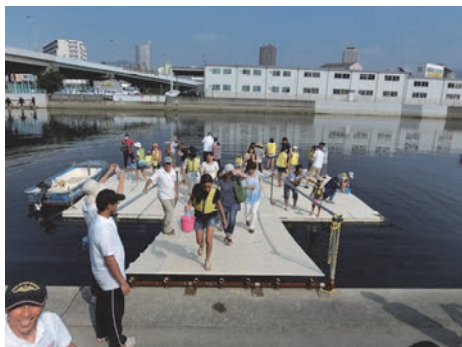
兵庫運河真珠貝プロジェクト