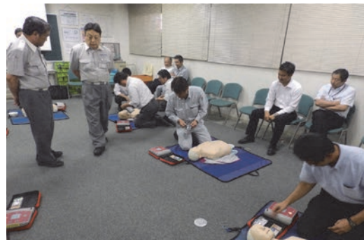
普通救命講習（AED）の実施