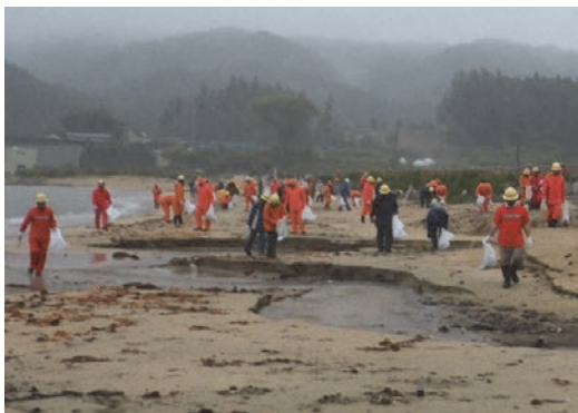
吉里吉里海岸大清掃 活動中の様子