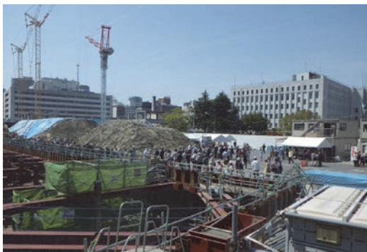
大坂城跡発掘工事現場での公開説明会