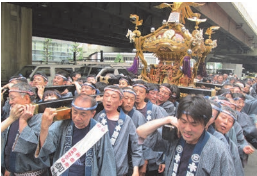
神田明神禮大祭に参加