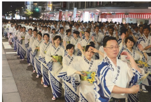
新潟まつり大民謡流しに参加