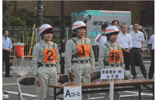
自衛消防活動審査会に参加