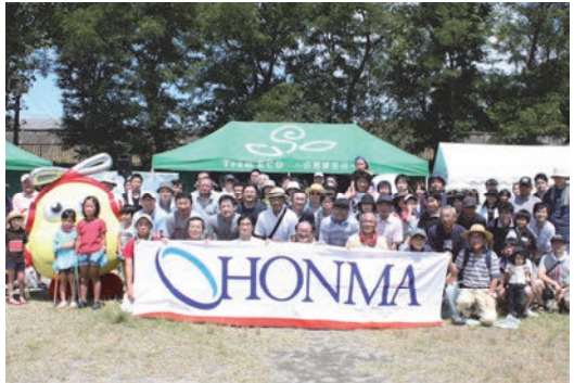
チームエコ活動への参加