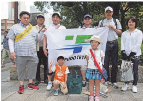
ごみゼロ・クリーンウォーク