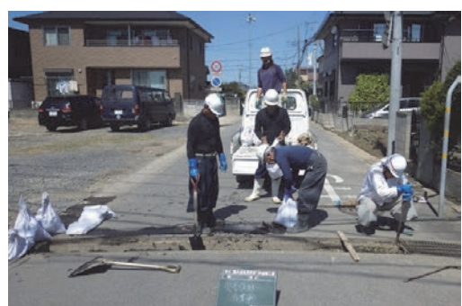
災害復旧ボランティア活動