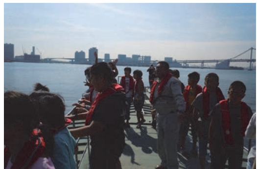
東京港で現場見学会を開催