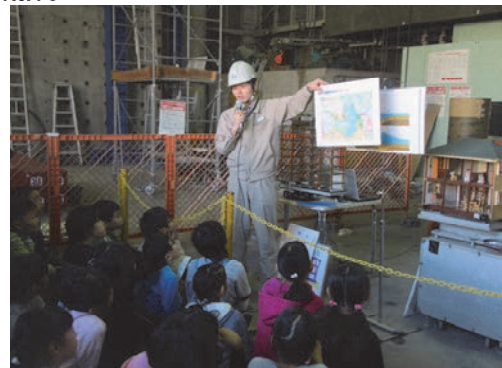
研究所見学会の実施