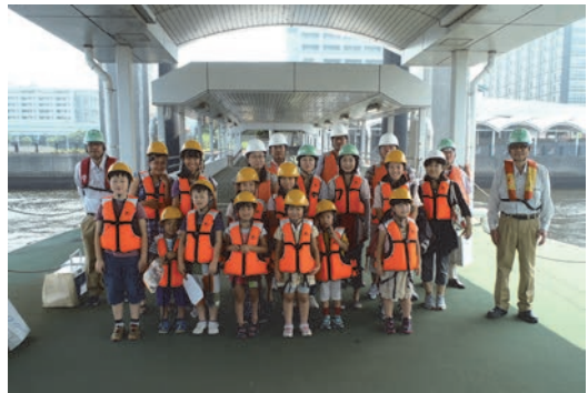
親子現場見学会の開催