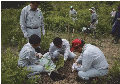
栗原市復興ふるさと植樹活動に参加