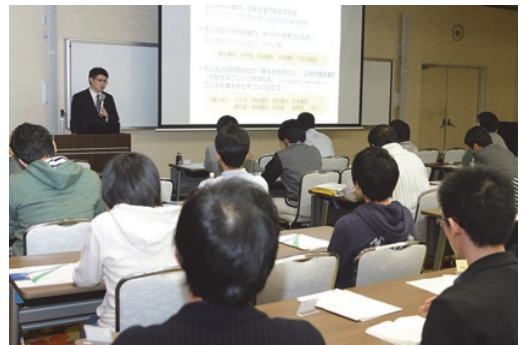
広島工業大学で講義