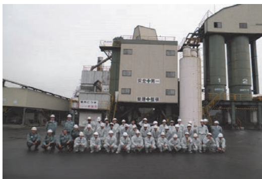
高校生を招き体験・見学会を開催