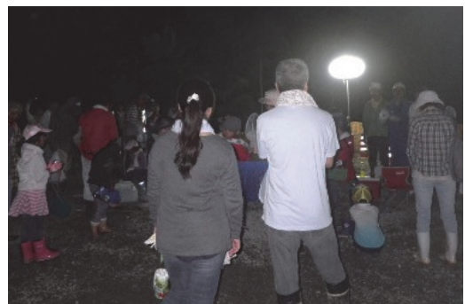
カブトムシ大会に協力