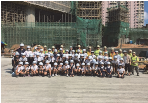
香港日本人小学生向け現場見学会