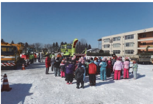
小学校での除雪機械試乗安全学習