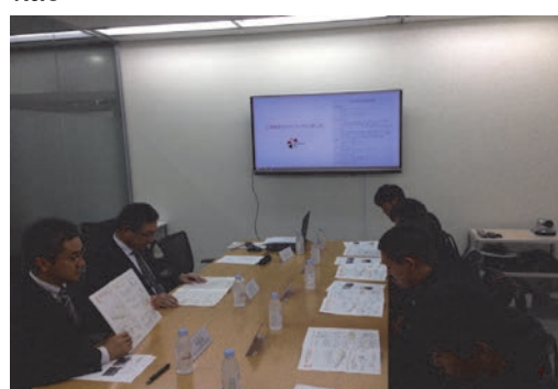
高等学校の企業研修