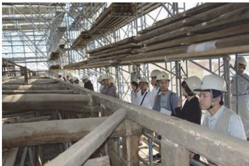
熊本藩川尻米蔵跡 見学会の実施