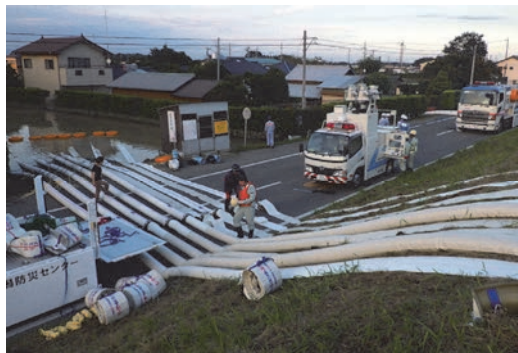
鬼怒川決壊による災害応援に緊急出動