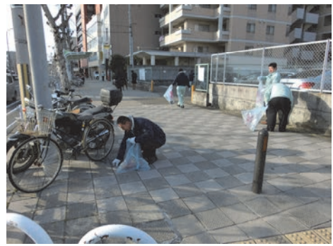
まちかどクリーン作戦