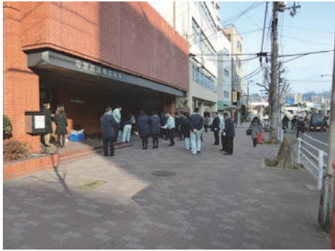
まちかどクリーン作戦