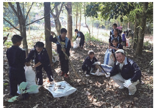
タイマエダの環境活動