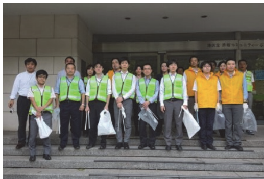
赤坂定期清掃活動