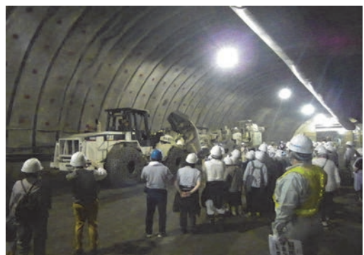
地域住民向け現場見学会