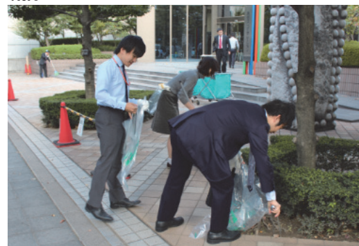
大阪マラソン“クリーンUP作戦”