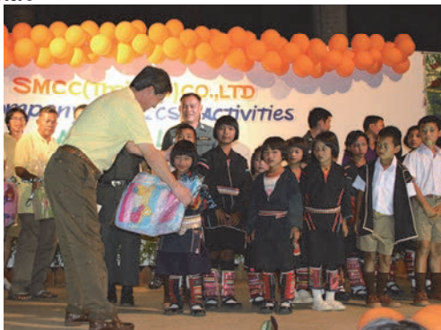
タイの山間部にある学校への寄付