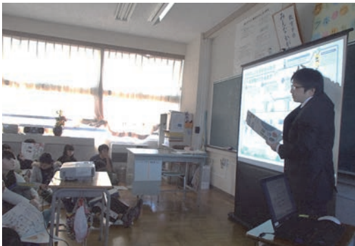
キャリア教育への講師派遣