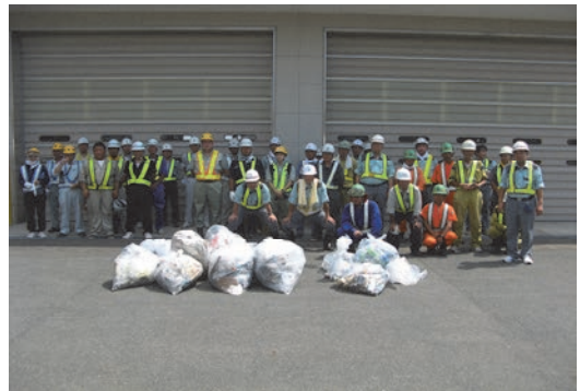
道路清掃美化活動