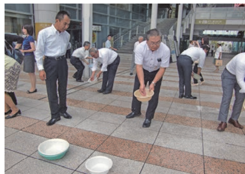
高松打ち水大作戦2015