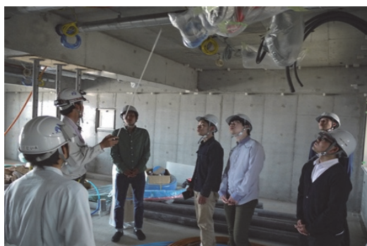
現場見学会・インターンシップ