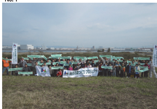
共生の森づくりプロジェクト