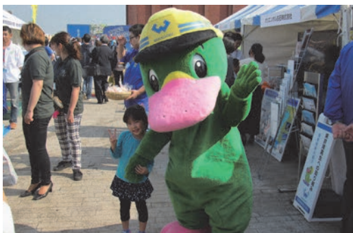
東京湾大感謝祭2015に出展