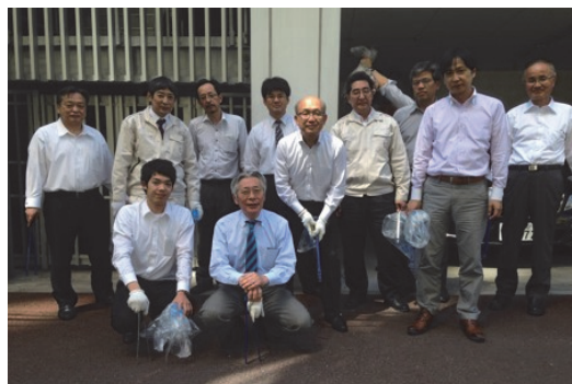
仙台まち美化サポート