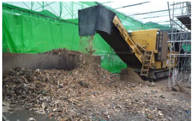
写真-8 可燃系混合物破碎状況