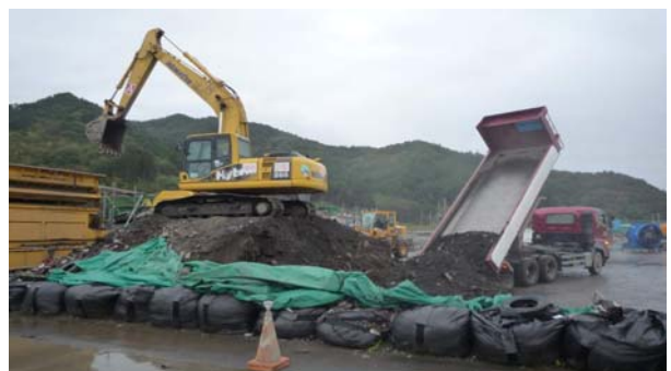
写真-2 廃棄物の受け入れ状況

写真-2に廃棄物の受入状況を示す。 一次仮置場にて粗選別した災害廃棄物を ダンプトラックにて運搬し、二次仮置場 に搬入する。 搬入する災害廃棄物は、可燃系・不燃系の それぞれの処理ヤードに降ろす。