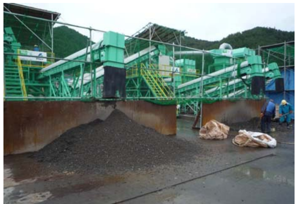
写真-10 比重差選別機選別状況

写真-10に比重差選別機選別状況を示す。 20mm～150mmサイズの可燃物とコンクリート がらの混合物を一旦同一径(0-40mm)に破碎 処理し、ふるい機にて土砂分を落とした後、 比重差選別機にて振動と風力とを用いて、 可燃物と復興資材(RC)とに選別する。