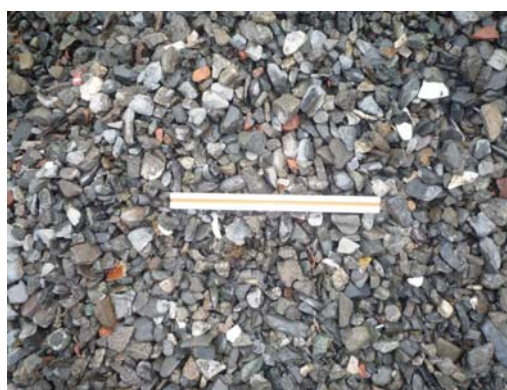
写真-20 再生砕石 40mm以下