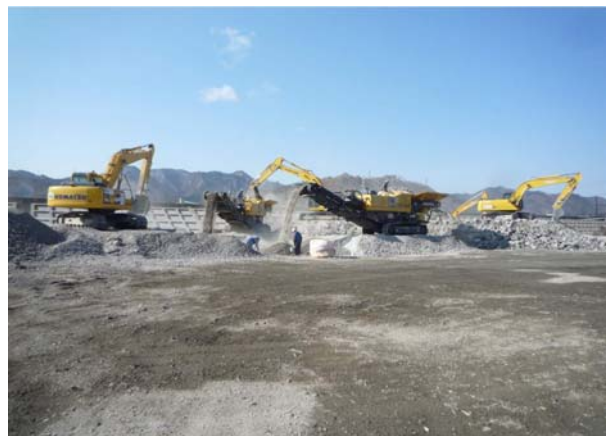
写真-9 コンクリートがら圧縮破碎

可・不燃混合物は、インパクトクラッシャー にて破碎してふるい機にて土砂分を落と した後、比重差選別機・湿式選別機にて可 燃物と砕石とに分別する。