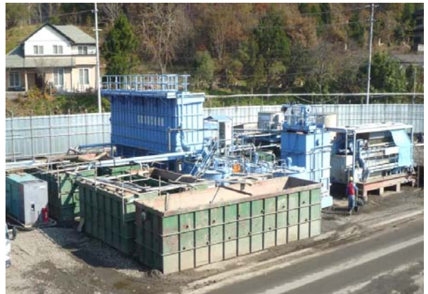
写真-21 濁水処理施設