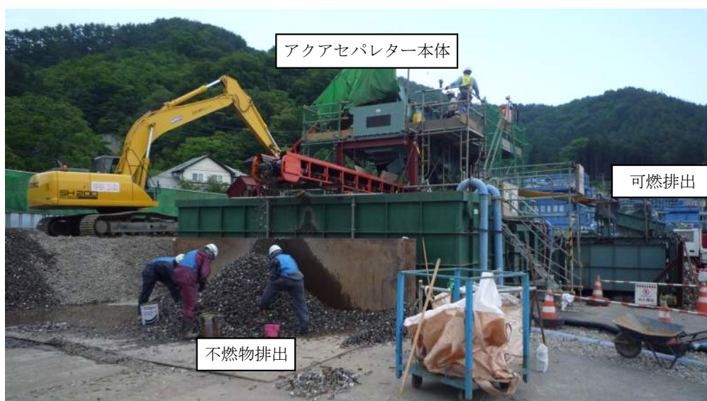
写真-17 湿式選別機ライン 全景