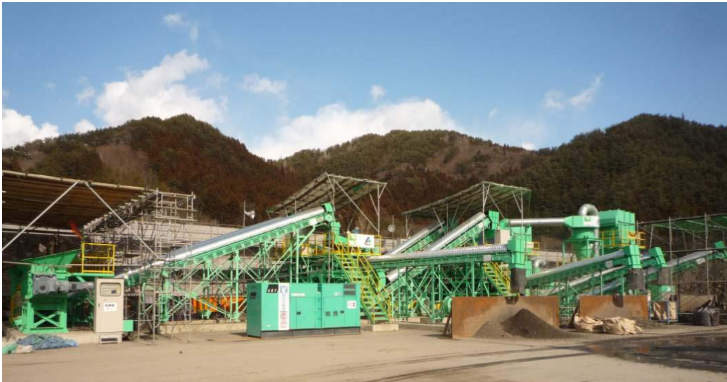
写真-13 比重差選別機システム 全景