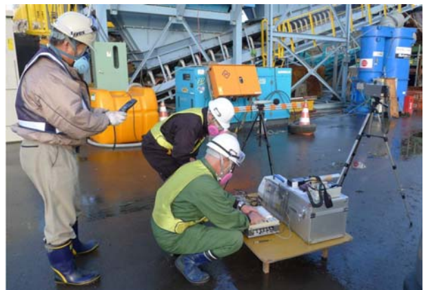
写真-22 作業環境モニタリング状況