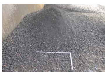
写真-15 再生碎石5mm以下