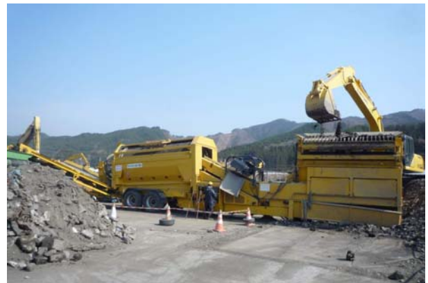
写真-4 回転式ふるい機選別

災害廃棄物をサイズ別に分別することを主体とするが、廃棄物の性状によって回転式ふるい選別機を用いる。 網目の違うドラムを回転させて、廃棄物を攪拌・たたきつけて、土砂分を落とすと共にサイズ別に分別する。