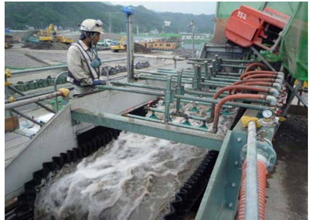
写真-11 湿式選別機(アクアセパレーター)

20mm～150mmサイズの可燃物とコンクリートからの混合物を一旦同一径(0-40mm)に破碎処理し、ふるい機にて土砂分を落とした後、湿式選別機にて振動と水流とを用いて、可燃物と復興資材(RC)とに分級する。また、洗浄水は濁水処理設備(100t/h処理)にて処理し、処理水は循環して洗浄水として再利用した。