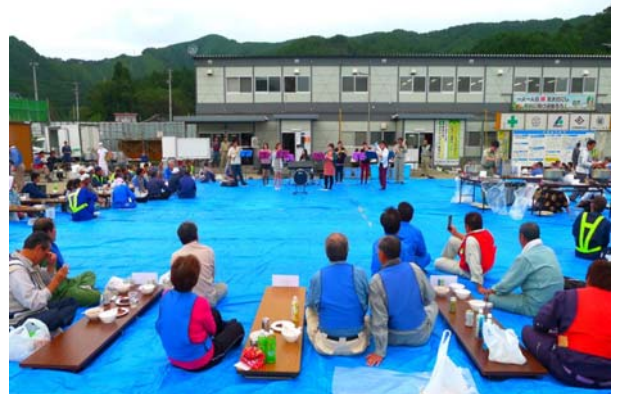
写真-24 「いも煮会」状況