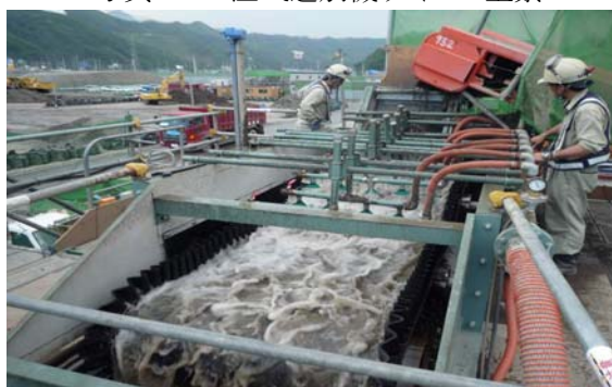
写真-18 アクアセパレーター本体選別状況