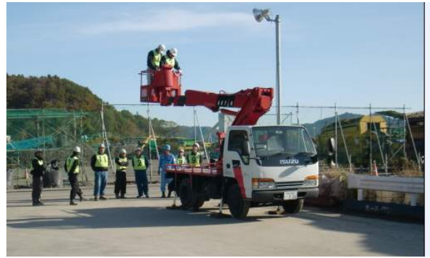
写真-23 高所作業車特別教育状況