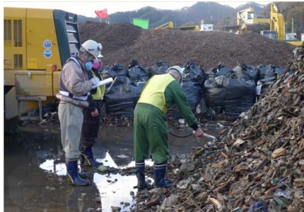
写真-12 可燃完成物放射線量計測

写真-12に可燃完成物放射線量計測を示す。破碎・選別処理を終えた完成品は、各処理施設に搬出するにあたり、各処理施設からの要望種別・形状に合致しているかとの品質確認および、廃棄物成分(組成・塩分・放射能・放射線量等)を計ると共に、復興資材については岩手県の復興資材活用マニュアルに沿って管理を行った。