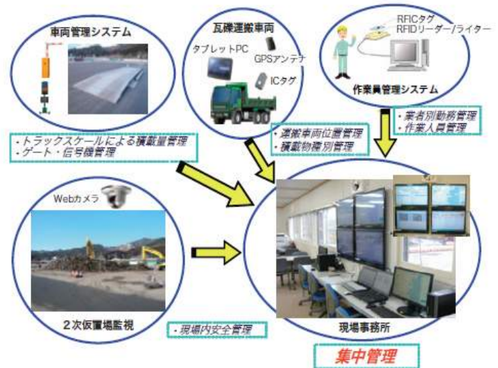
図-3 運行管理システム全体イメージ

図-3に運行管理システムのイメージを示す。災害廃棄物または処理物の運搬車両により、一般交通の障害、および粉塵等による周辺環境の悪化が懸念されるため、新たに運行管理システムを開発し円滑かつ安全な運行管理を行う。本システムは4つのモニターとコンピューターで構成され、現場事務所にて日付・運転者・車番・積荷・積載重量・積載場所・荷降先と現在の車両位置等を一括して管理できるシステムとなっている。