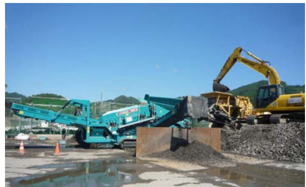
写真-5 振動式ふるい機選別

災害廃棄物をサイズ別に分別することを主体とするが、廃棄物の性状によって振動式ふるい選別機を用いる。 網目の違う格子を振動させて、廃棄物の土砂分を落とすと共にサイズ別に分別する。