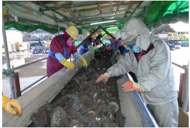
写真-7 ピッキングライン人力選別

【ピッキングライン人力選別】写真-7 粗選別後の廃棄物を選別機によって選別 した後、ベルトコンベアにその分別物を 流し、人力によって再選別を行なう。