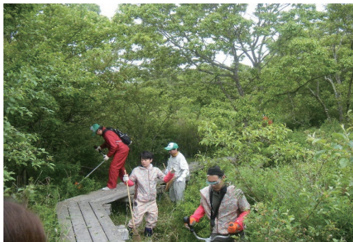
ウトナイ湖散策路環境整備