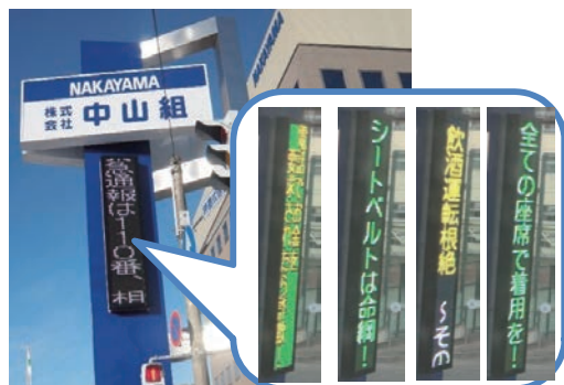
電光掲示板による情報提供