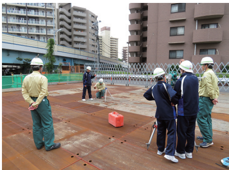
中学生の職場体験学習