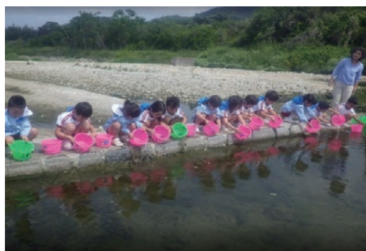
鮎の稚魚放流サポート