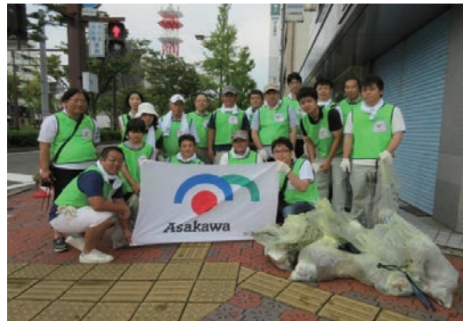
紀州路クリーン大作戦の清掃活動