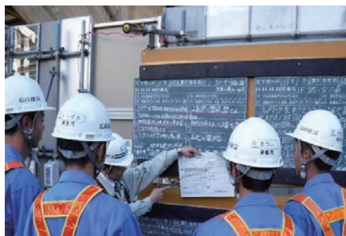
就業体験（インターンシップ）実施