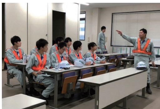
夏季インターンシップ