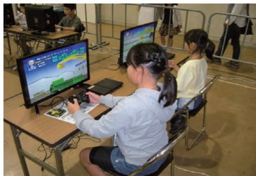
「こどものまちミニさっぽろ」に出展