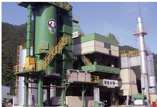
町のキャラクターで復興支援