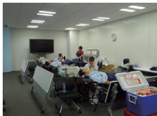
東京都赤十字血液センターによる献血