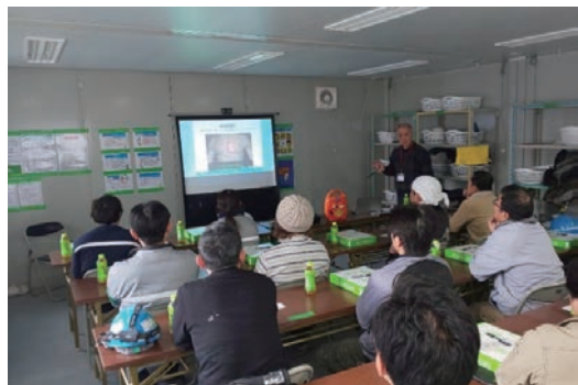
救命・応急処置講習会の開催