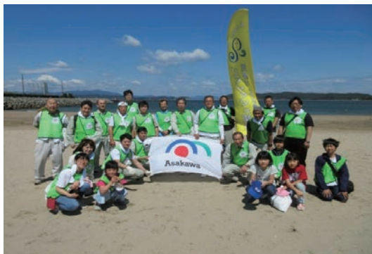
リフレッシュ瀬戸内の清掃活動