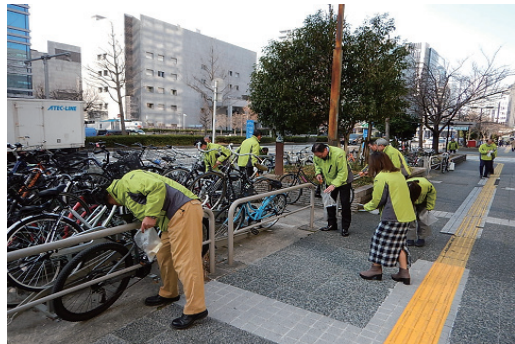
ボランティア清掃活動の実施