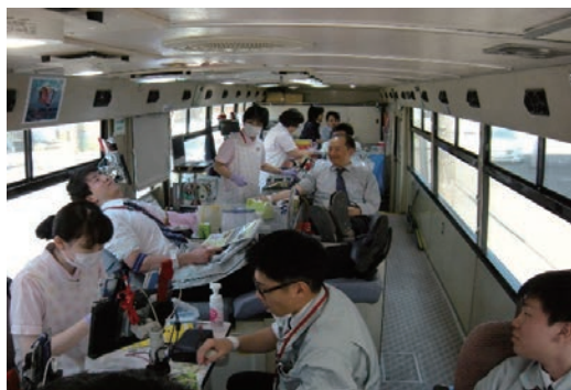
移動献血車による献血の協力活動