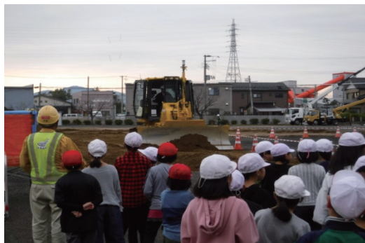
小学生対象の現場見学会