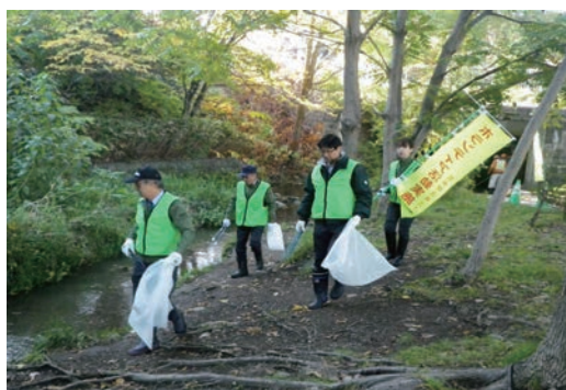
札幌市豊平区とのアダプト活動