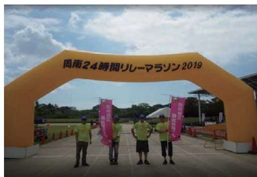
リレーマラソンボランティア