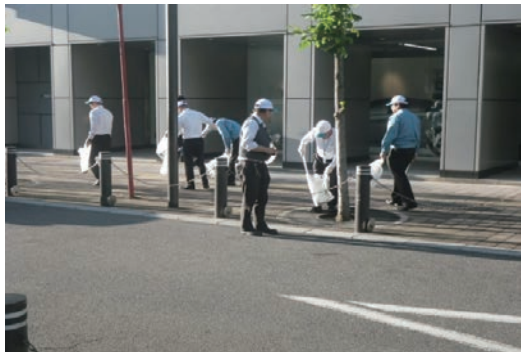
オフィスビル周辺の清掃活動