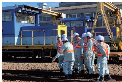
冬季インターンシップ