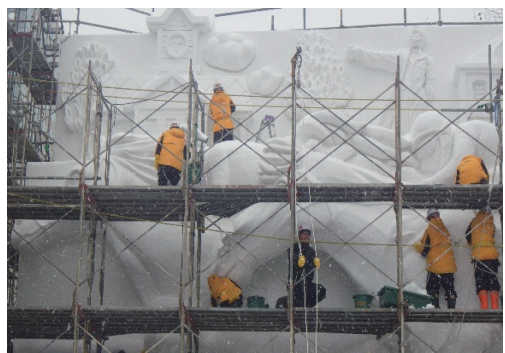
「さっぽろ雪まつり」大雪像制作