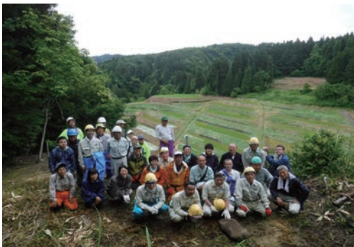
ECHIGO棚田サポーター活動