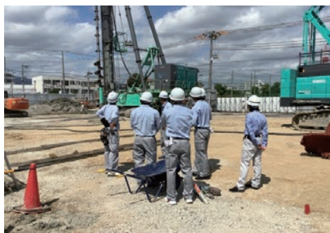
インターンシップの受け入れ