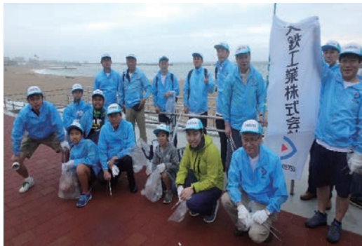
須磨海岸クリーン作戦