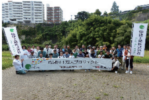
みやぎスマイルサポーター活動