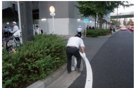
名古屋駅前通りの清掃活動