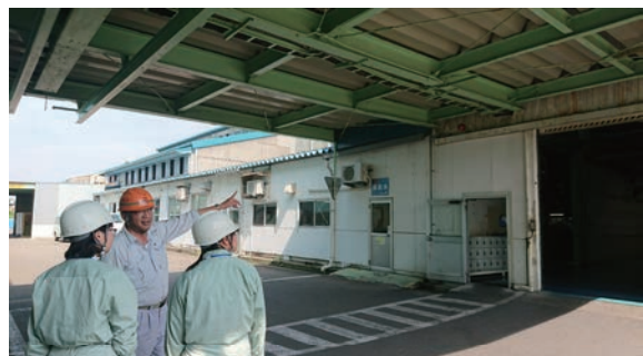
インターンシップの受入れ