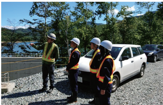
インターンシップの受け入れ