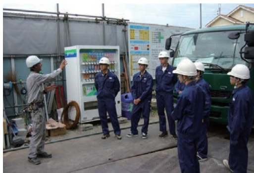
現場見学会の開催