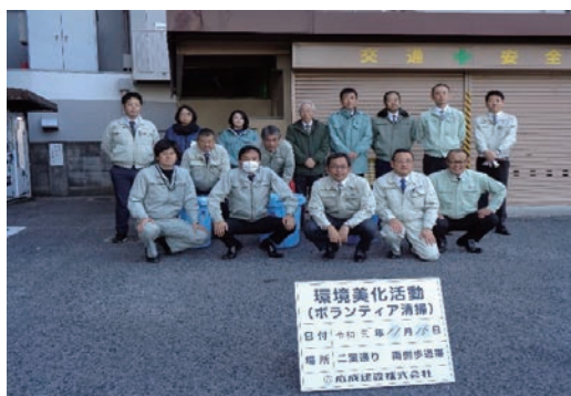
広島市まちの美化に関する里親制度