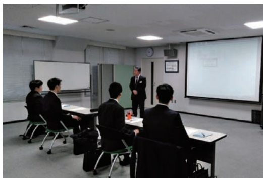
冬季インターンシップ