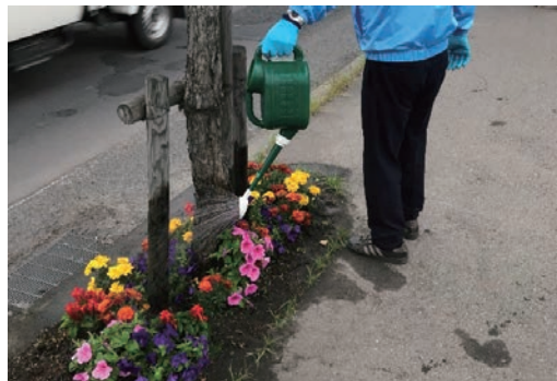
植樹樹への花植え