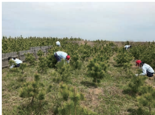
千年希望の丘植樹活動