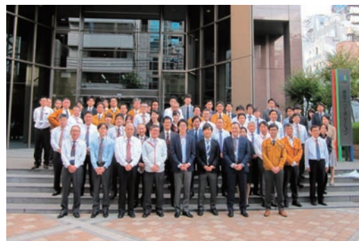
大阪マラソンクリーンUP作戦