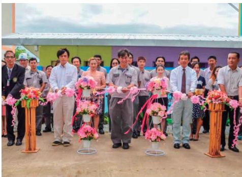
タイ地元小学校へのトイレ寄贈