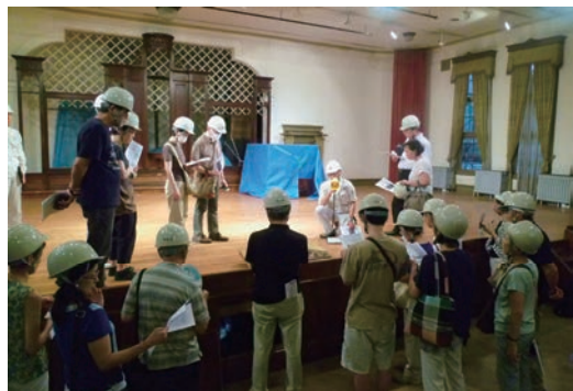
重要文化財保存活用工事見学会