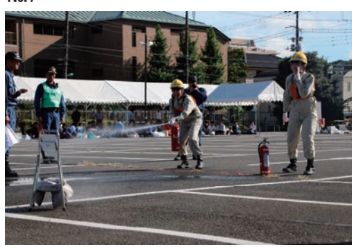
自衛消防活動審査会に参加