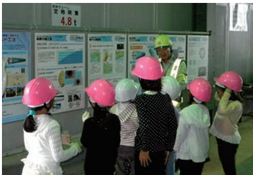
田尻今宿污水幹線工場の現場見学会