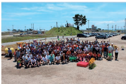
ひまわりプロジェクト2016