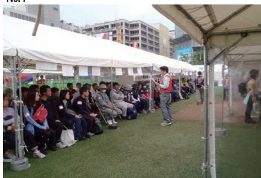
新入社員による熊本震災復興支援活動