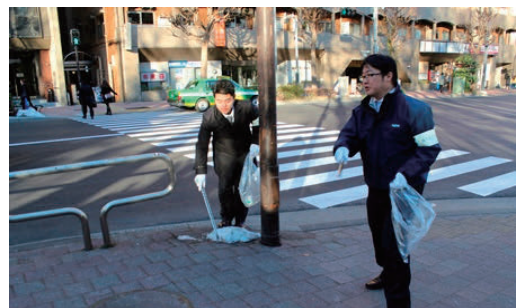
西新宿清掃ボランティア活動