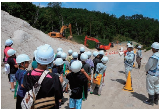
現場見学会「田野畑復興はどこまで？」