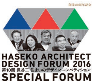
長谷工 住まいのデザインコンペ