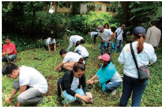
洪水被災地区の支援活動