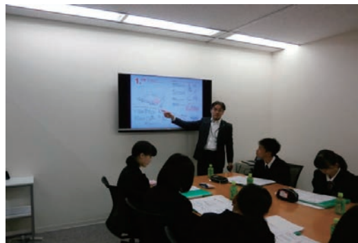
中学生の企業研修を受け入れ