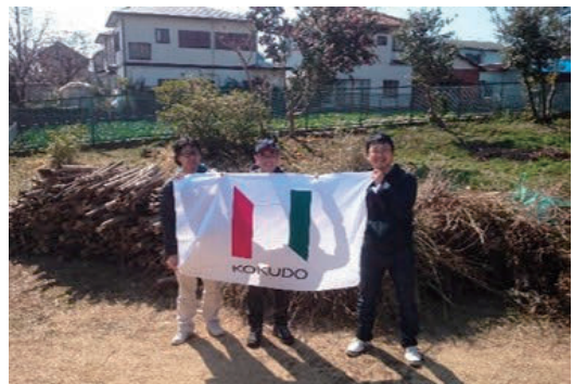
旧モーガン邸庭園 清掃活動