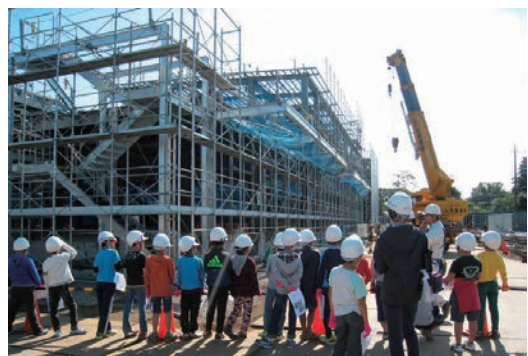
現場見学会「福生市防災食育センター」