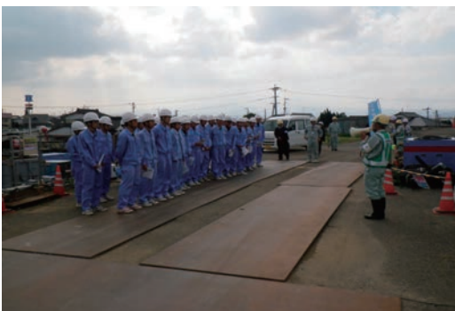
福富天神排水樋管工場の現場見学会