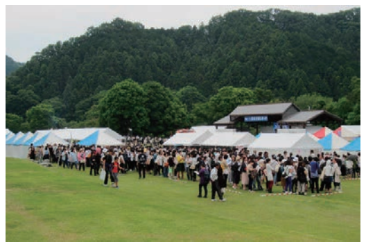
おもしろ歴史フェスティバルに協賛