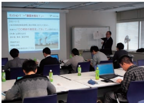
インターンシップの受け入れ