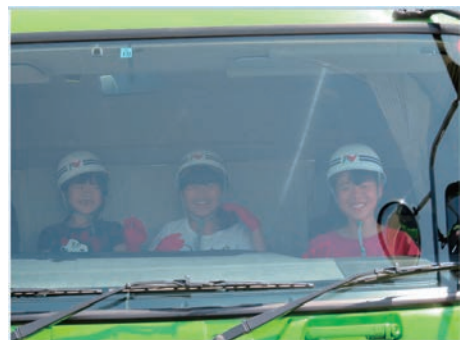
夏のリコチャレを開催