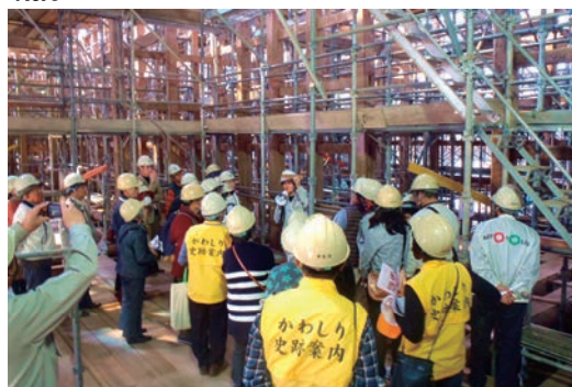
川尻米蔵跡外城蔵保存修理見学会