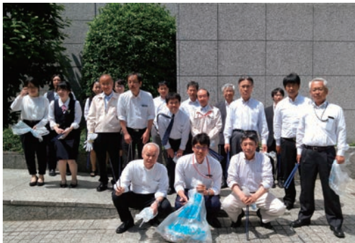
仙台まち美化サポート