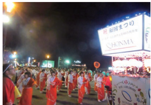
新潟祭り大民謡流し参加