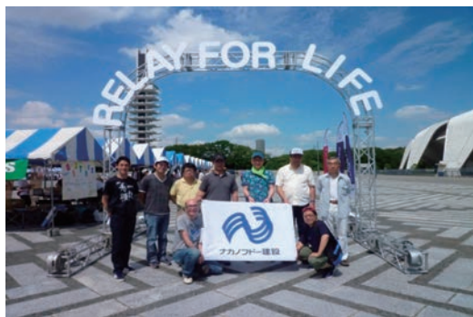
がん征圧イベント