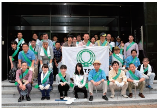
地域の環境美化活動