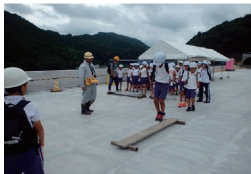
工事現場見学会（小学生）