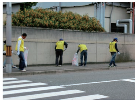
兵庫運河を美しくする会