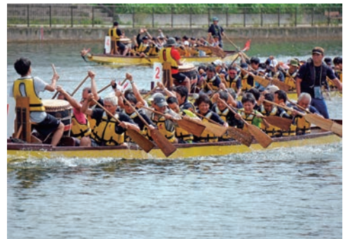
名古屋市中川運河ドラゴンボート大会