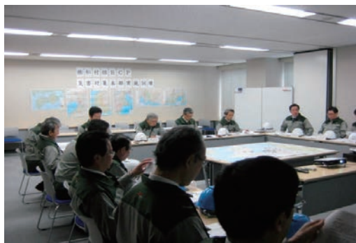
B C P訓練の実施