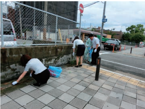
兵庫区民まちかどクリーン作戦