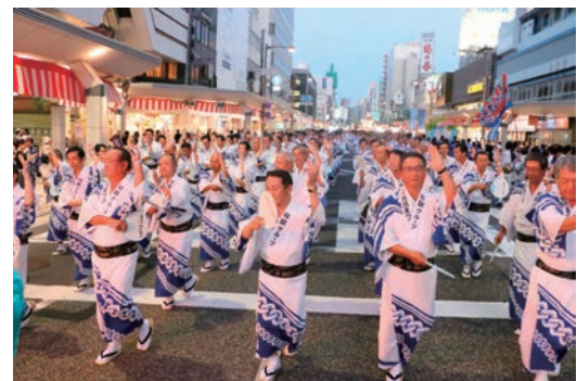
新潟まつり大民謡流しに参加