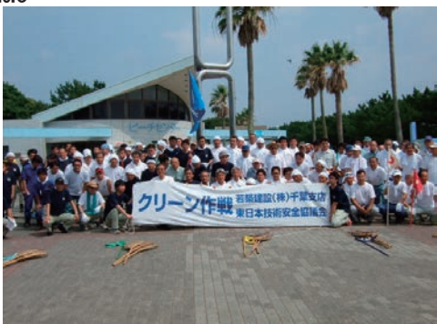
いなげの浜クリーン作戦