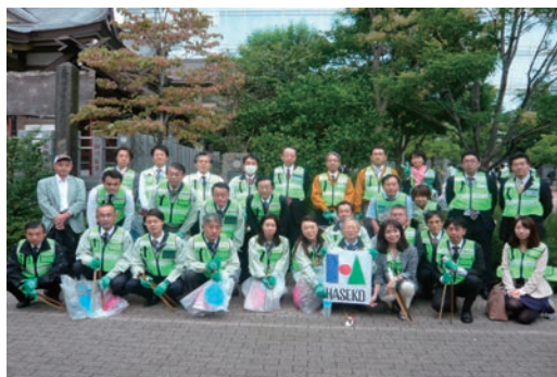
芝地区クリーンキャンペーン