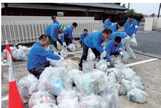
第9回 広陵町清掃ボランティア活動