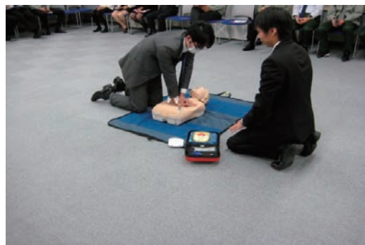
A E D操作訓練の実施