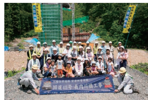
工事現場見学会（協力会社ご家族）