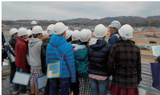
作業所体験学習を実施