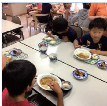
子ども食堂を支援