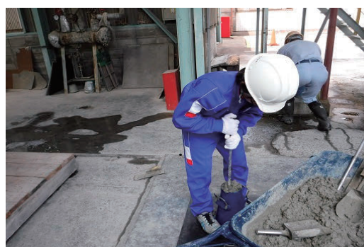
中学生職場体験学習