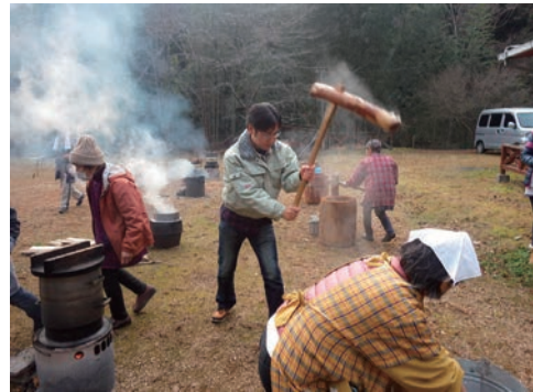
地域行事（餅つき）への参加