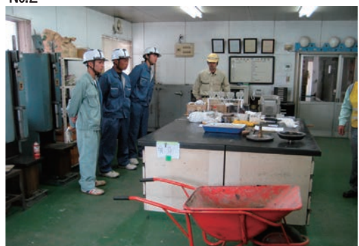
高校生を招き実習と工場見学会を実施