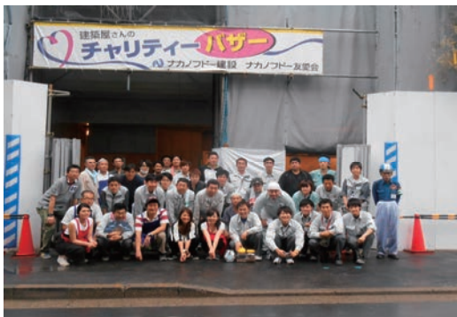
建築屋さんのチャリティー