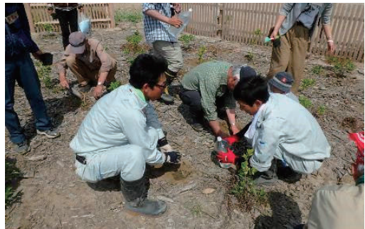
海岸きずなプロジェクトII