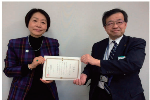
「世界の子どもにワクチンを」活動協力