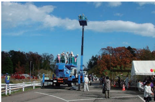
山元町ふれあい産業祭に参加