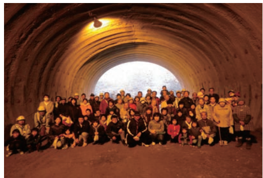
鳥取西道路鹿野トンネル貫通