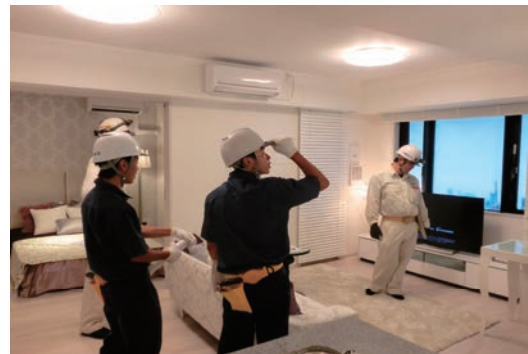
名古屋市立工芸高等学校就業体験