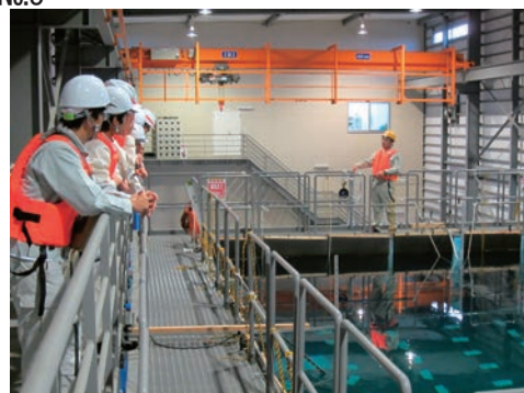
現場見学会を開催