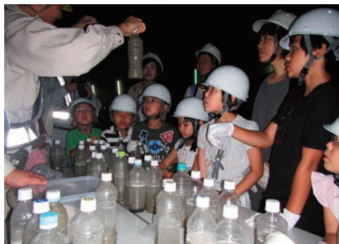
ペットボトルで濁水浄化実験