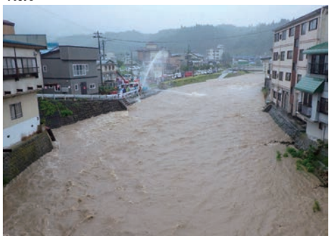
ポンプによる排水作業