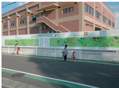
地域保育園児の絵の展示