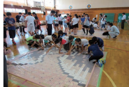
建築現場イメージアップ活動