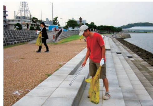
2016松江水郷祭早朝清掃への参加