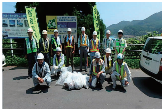
全社一斉清掃活動