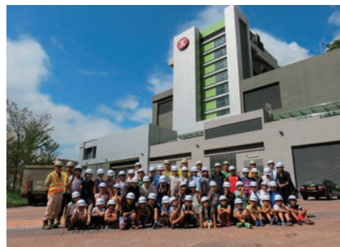
現場見学会を開催