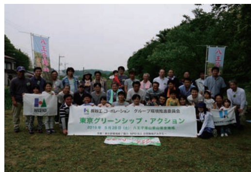
八王子滝山里山保全地域活動