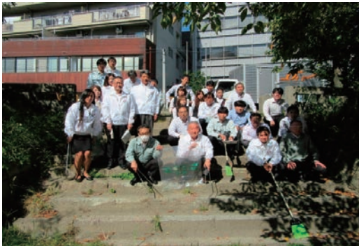
大阪マラソンクリーンUP作戦に参加