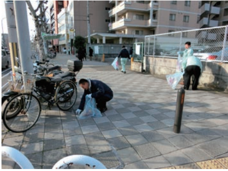
兵庫区民まちかどクリーン作戦