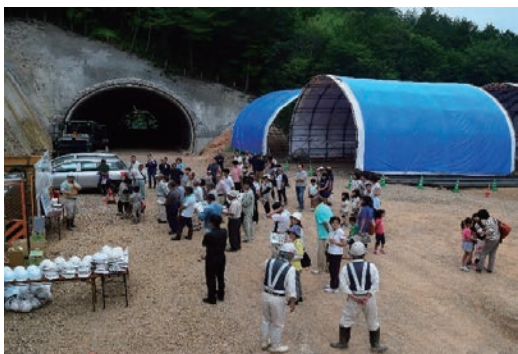
小洞トンネル作業所現場見学会