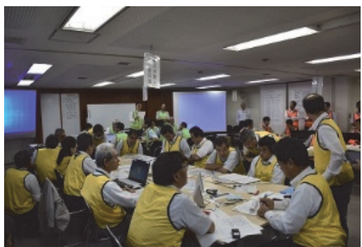
BCPに基づく防災訓練