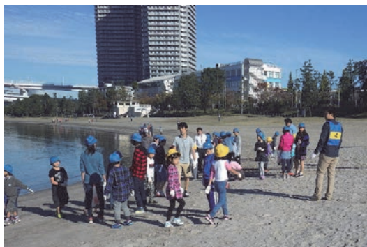
お台場海浜公園クリーンアップ活動