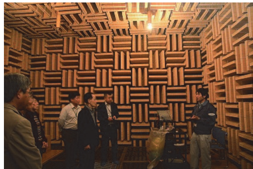
「環境・防災」見学会