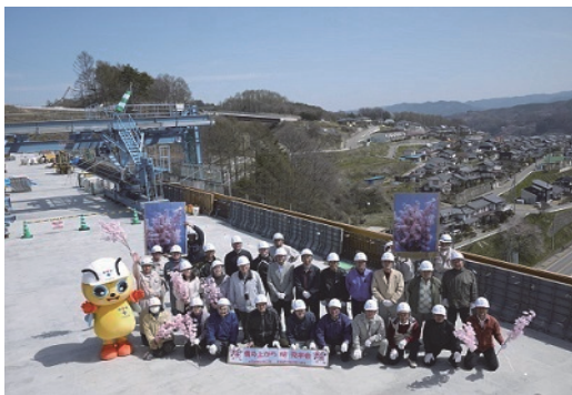
地元住民による現場見学会