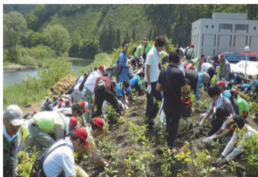
第4回平成の杜植樹会