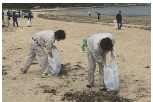
新宮町クリーン作戦