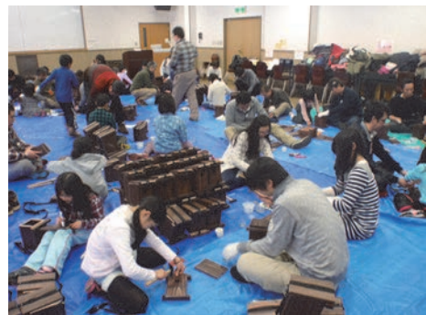
「ヤマネの巣箱づくり」