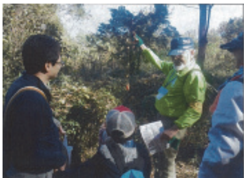
「いきいき里山づくり」東京都町田市