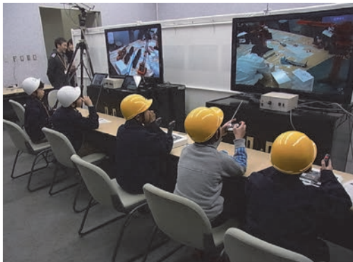
とうきゅうキッズプログラム