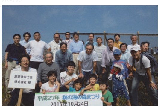
「海の森」植樹ボランティア