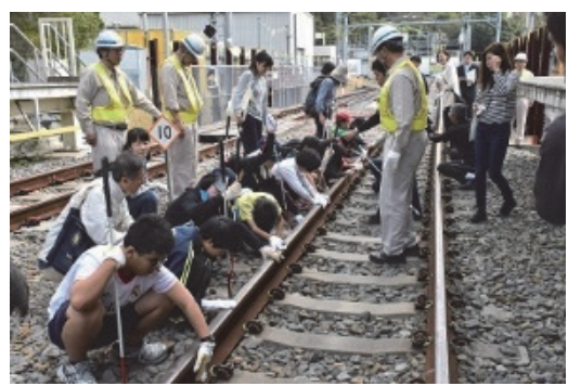
盲学校生徒による鉄道体験会