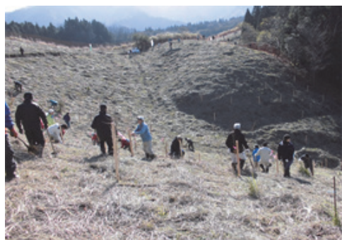
水土里ネットの森の補植、鹿ネット張り