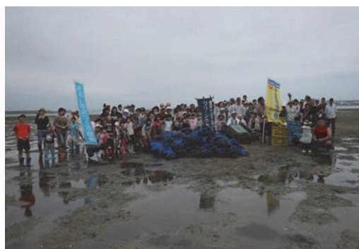
福岡和白干潟清掃活動