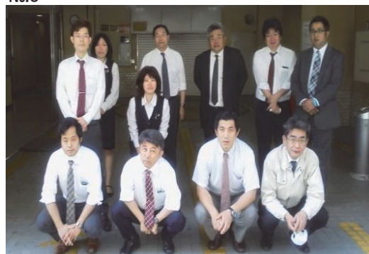
まち美化パートナー