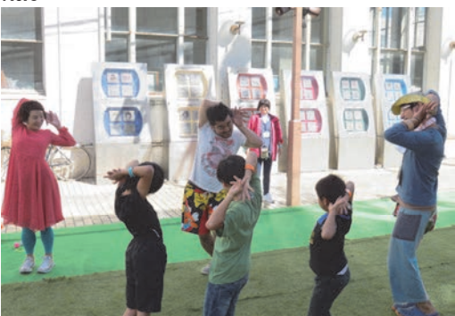
ダンサーと一緒に踊る子どもたち