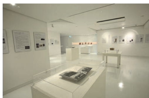
ギャラリー・タイセイ会場風景