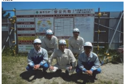
インターンシップ生徒の受け入れ