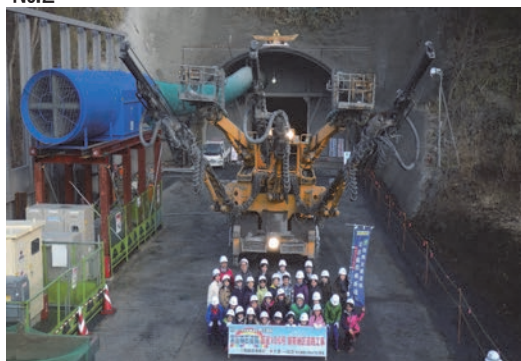
地元小学生の受入