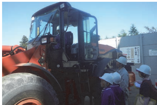
三村小学校3年生の社会科見学