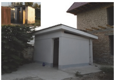
現場仮設トイレの寄贈