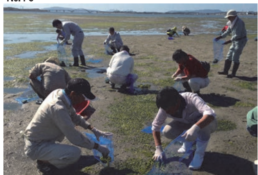
和白干潟あおさの清掃活動