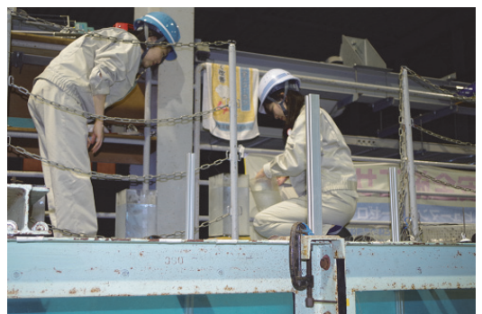
インターンシップ生の受け入れ