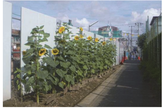
市川市内の花と緑の普及促進活動