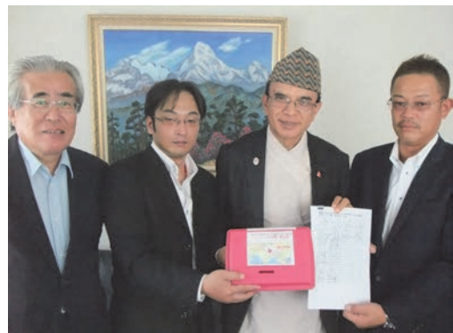
ネパール在日大使へ義援金を寄付