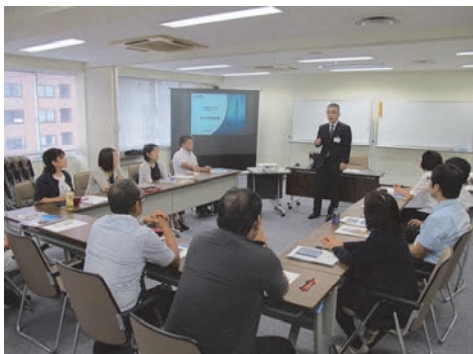
「教員の民間企業研修」への協力