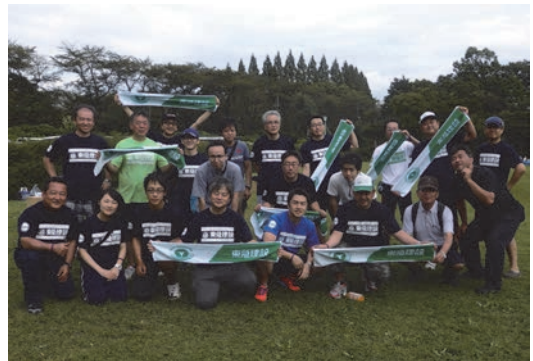
リレーフォーライフジャパン