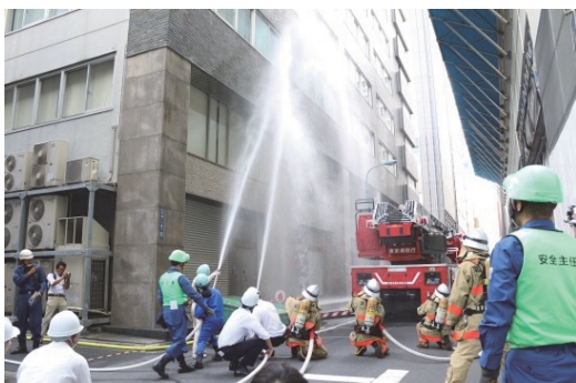
京橋地域総合防災訓練