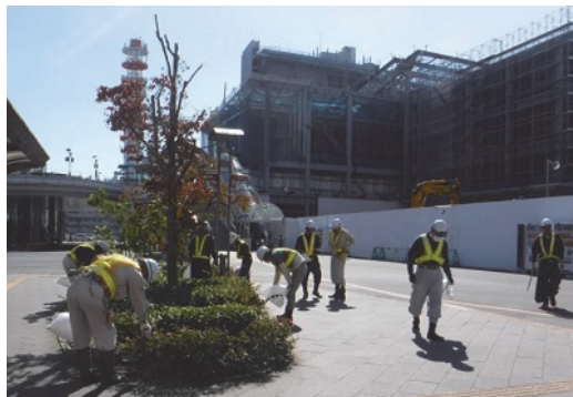
仙台駅周辺一斉清掃