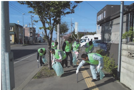
札幌市西区アダプト・プログラム