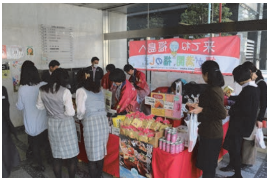
ふくしまマルシェ