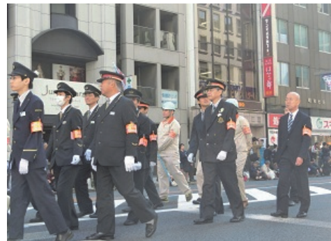
日本橋・京橋まつり