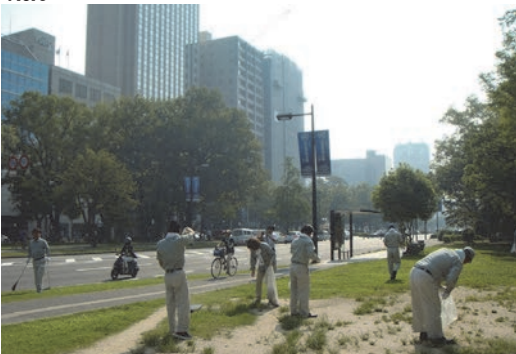
広島平和記念式典に向け道路清掃