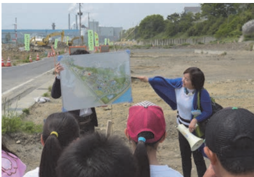
ワークショップで公園計画地の説明