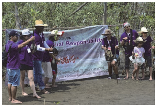
マングローブ植林活動