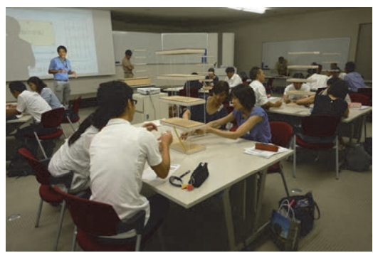
教員の方々が建築構造の授業を受講