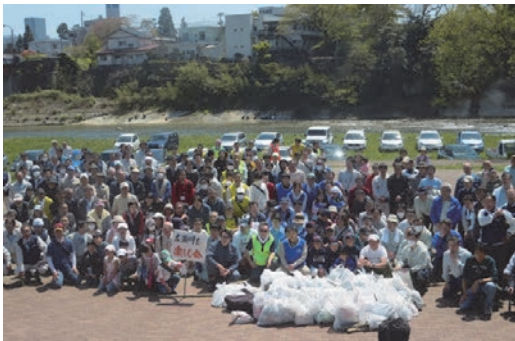
広瀬川流域一斉清掃