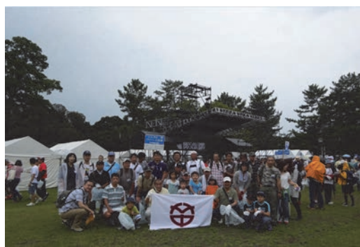
クリーンアップならキャンペーン