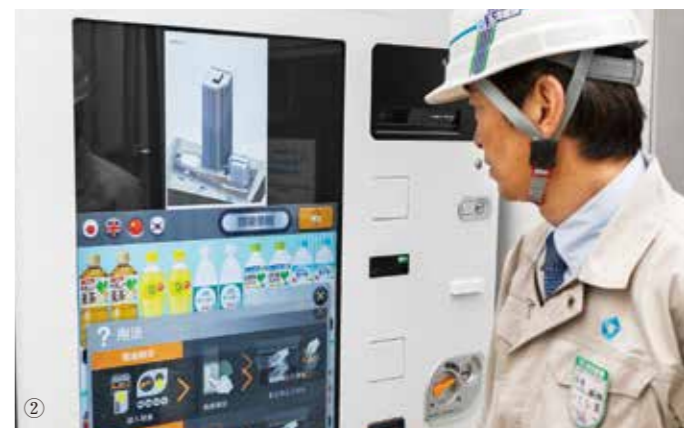
① 気分転換コーナー。には、卓球台やビリヤード台、ダーツなどが設置され、休憩中や仕事終わりに職人たちが交流を深める姿も。(現在は一時的に休止中) ② 飲料の自販機に組み込まれたデジタルサイネージ。工事概要や工程表を見ることができる。 ③ 仮設事務所側面の「ボルダリングウォール」。安全帯をかけるロープも完備されている。