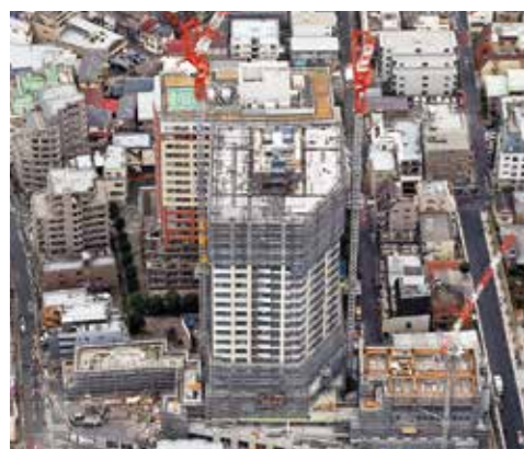
北西上空から施工中の現場を見る。

あれをやめたかったんです」 座席を担当ごに集めてしま と、自分の領域の仕事しかやらない 人が増え、他の担当との対話が生ま れない。この事務所のような配置で あれば、自分の仕事に打ち込みたい 時は壁に向かって集中できる一方、 話したいこと、確認したいことがあ ればすぐ隣や背中合わせに座ってい る同僚と気軽にコミュニケーションを 取れる。お互いのPC画面が見やす いというメリットもある。