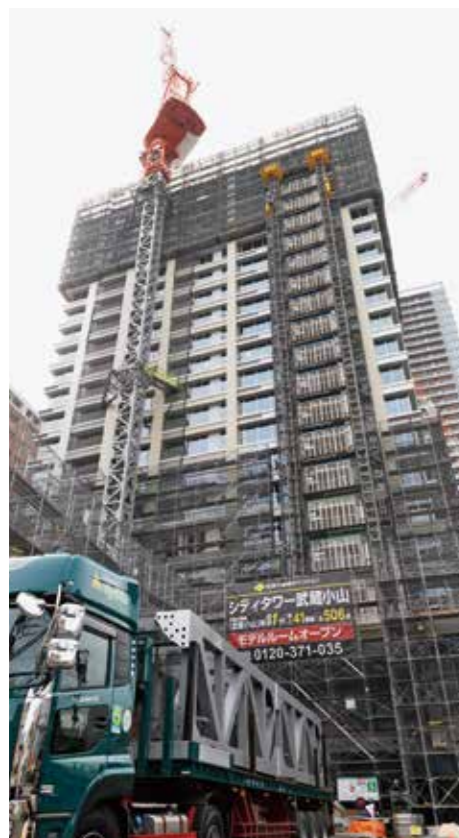
タワークレーンのクライミング準備中。駅前再開発のため敷地面積が狭く、気を遣う点も多い。