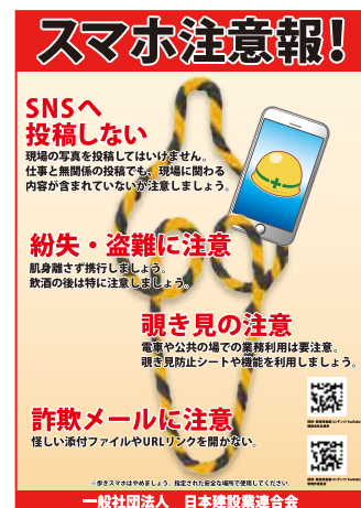
情報セキュリティポスター「スマホ注意報」

また動画は、建設現場で働く職員や技能者個人での視聴や、新規入場者教育での視聴を想定しています。職員を対象とした全体版、技能者を対象とした抜粋版のほか、図面紛失・報告遅延、コンピュータウイルス感染などの5項目に分けたものを、使用用途に合わせて複数用意しています。そしてポスター、動画コンテンツとも英語版もついています。