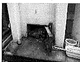
劣化（はく落した断熱材が点検口内に堆積）