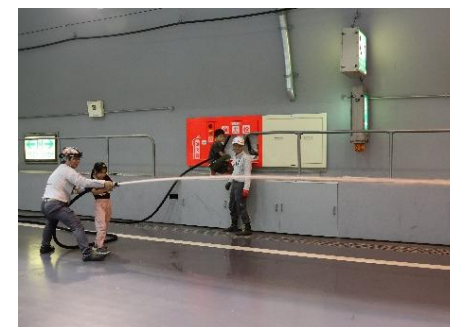
消火栓の放水体験※