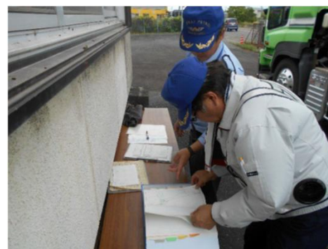
通行許可書の経路・通行条件等を確認