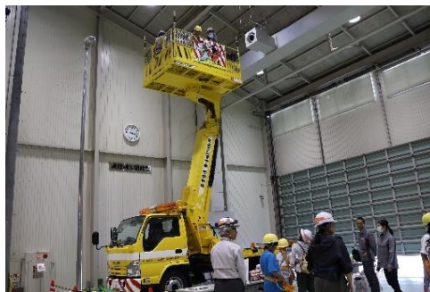
高所作業車の試乗体験※