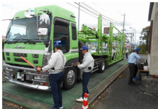
車体の総重量・長さ・幅・高さを計測

違法に重量を超過した車両は、道路や橋などの構造物に多大なダメージを与えます。また、高さや幅を超過している車両が橋梁等に衝突する重大事故も発生しています。道路の構造を守り、交通の危険を防ぐため、特殊車両通行許可が適正に履行されているかの確認を目的に、警察と連携し指導取締を実施しました。