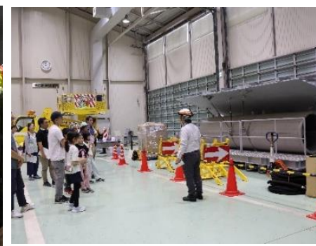
トンネル非常用設備の説明※