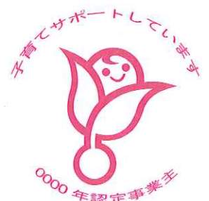
次世代認定マーク「くるみん」

ポジティブ・アクションに取り組む企業・ 両立支援に取り組む企業の皆さまの 積極的なご応募をお待ちしています！