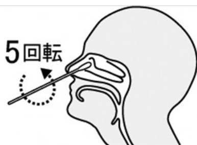
鼻腔ぬぐい液採取