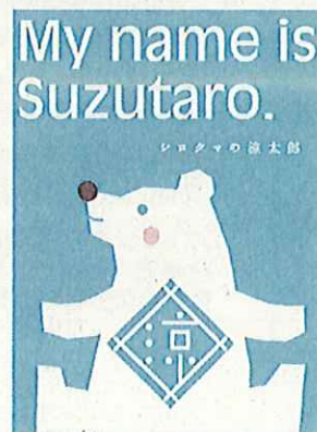
キャンペーン キャラクター 「涼太郎」