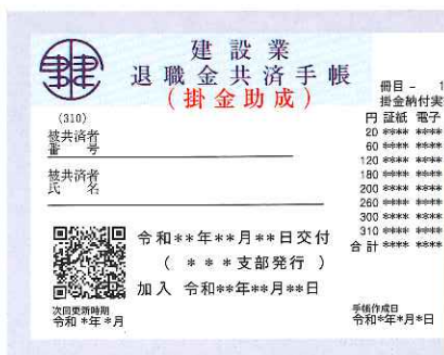
初回交付の共済手帳 (掛金助成)