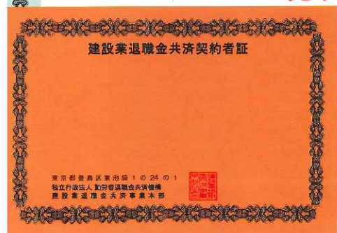
共済契約者証(中小企業用)