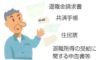
建退共退職金額比較表

び電子申請により掛金納付された日数の合計が12月(21日分を1ヶ月とらの請求により、その請求人個人の普通預金口座に直接支払われます。