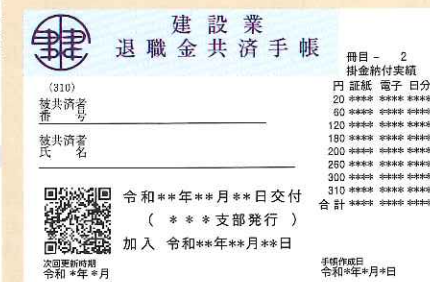
2冊目以降の共済手帳