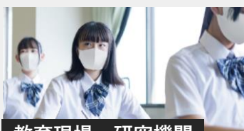
教育現場・研究機関

お客様訪問がある接客クルーやどうしても出社せざるを得ない職場でも、安心して働けることを目指します。