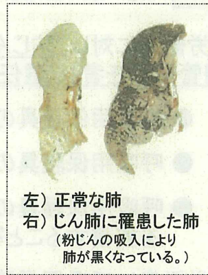
左) 正常な肺 右) じん肺に罹患した肺 (粉じんの吸入により肺が黒くなっている。)

現在、じん肺を治す根本的な治療がないため、じん肺にかからないための措置として、粉じんの発生源対策、局所排気装置等の適正な稼働、呼吸用保護具の適正な着用などにより、粉じんへの「ばく露防止対策」を徹底することが重要です。