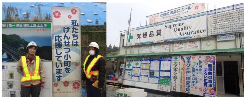
①横断幕による啓蒙