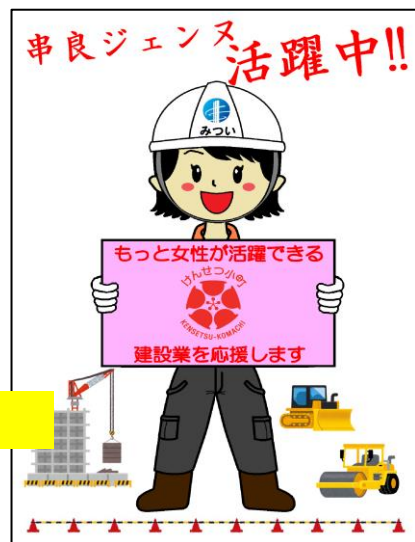
⑤串良ジェンヌポスター製作