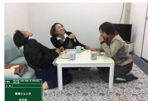
③串良ジェンヌ女子会開催(定期)