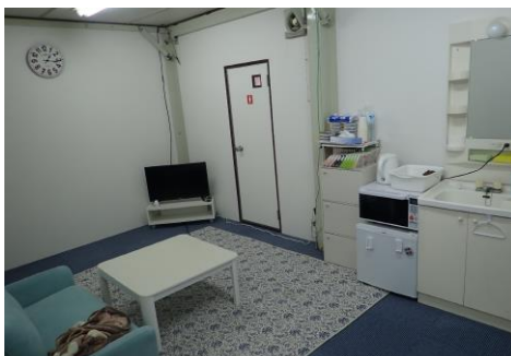
②串良ジェンヌ専用ルーム完備