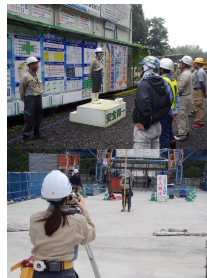
⑥女子大生インターン受入れ