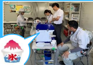
熱中症対策を推進!