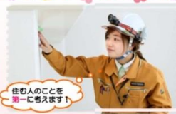
住む人のことを第一に考えます！

建設業で働く女性を「けんせつ小町」と日本建設業連合会（以下、日建連）は制定しています。建設業の一つである長谷工グループも、グループで働く女性社員のことを「ハセジョ（長谷女）」という愛称で呼ぶことで、建設業で女性が働くことを推奨しています。