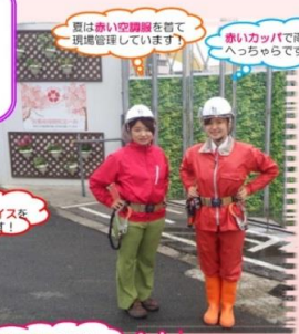
暑い夏は空調服を着て現場管理しています！ 暑い帽子で雨の日もへっちゃらです！

JR淀川区塚本作業所では、二人のハセジョが施工管理として働いています。女性ももっと建設現場で活躍できるよう、以下の活動で現場を盛り上げていきたいと思っています！