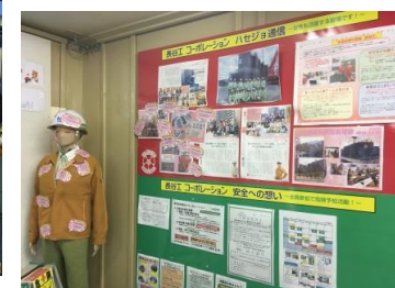
掲示物で女性が活躍していることをアピール