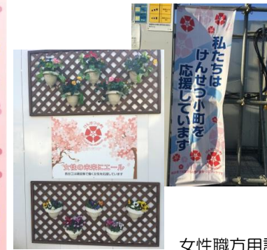
女性職方用詰所を整備中