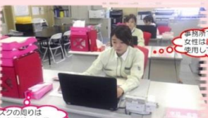
事務所では女性も赤色のイスを使用しています！