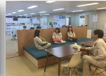
①打合せスペース(土足エリア)