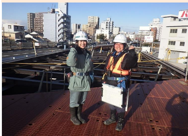
伝馬坂∞チームの女性陣