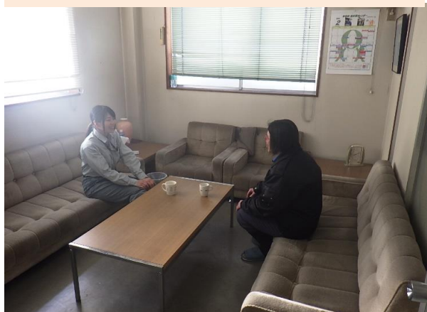
リフレッシュルームで気分転換！