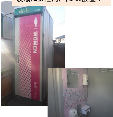
現場に女性用トイレの設置！