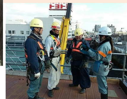
鳶さん達に的確な？指示を出す！