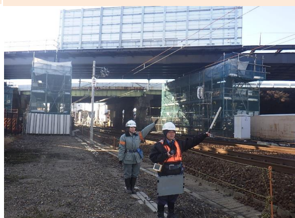
列車接近中！(通過するまではピクリともしません)