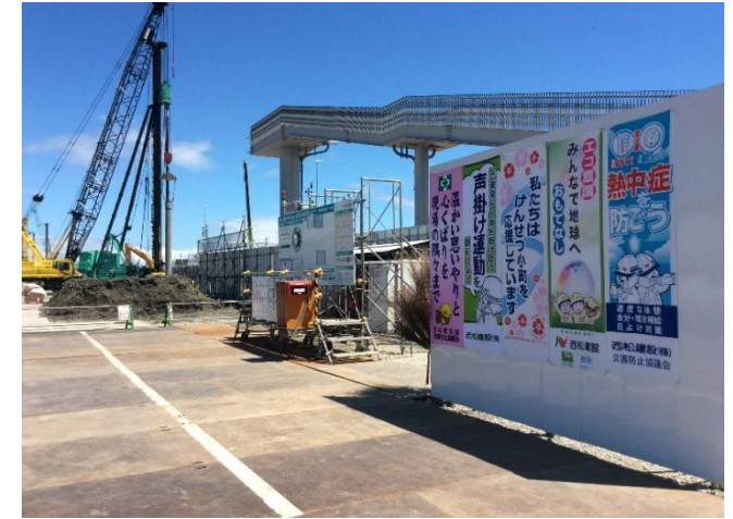
現場内けんせつ小町応援垂幕