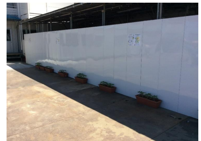
ひまわりプロジェクト