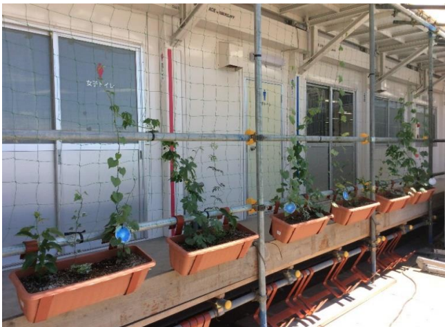
グリーンカーテン