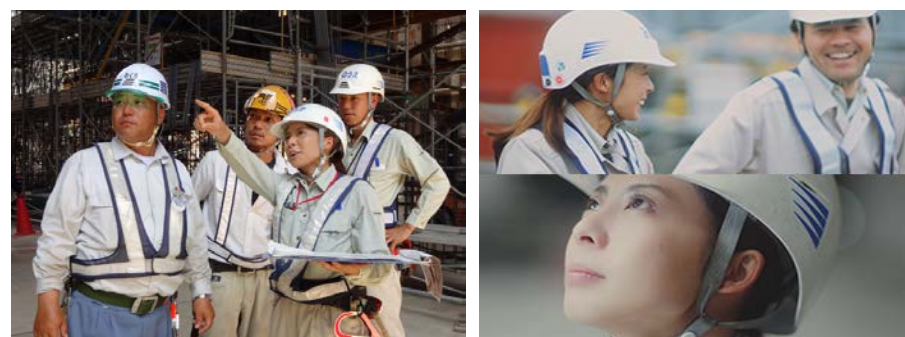
建設業で女性が活躍できることの対外的アピール

出前授業や職場体験学習を通じて、造るよろこび、やりがいのある職場であるということをお子に伝える草の根活動を実施