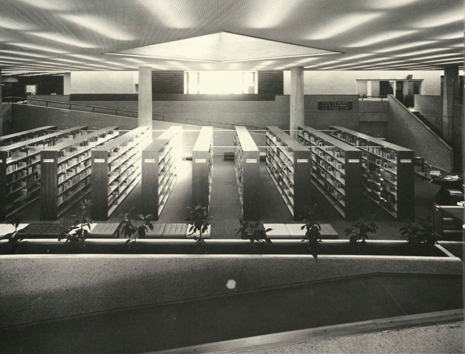
中央ホール Central hall.