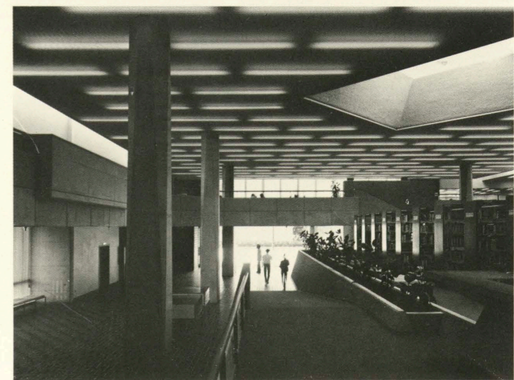
通り抜け通路から玄関をみる Entrance seen from the passageway.