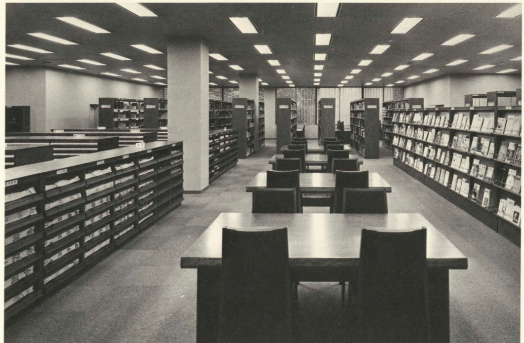
参考資料室 Reference room.