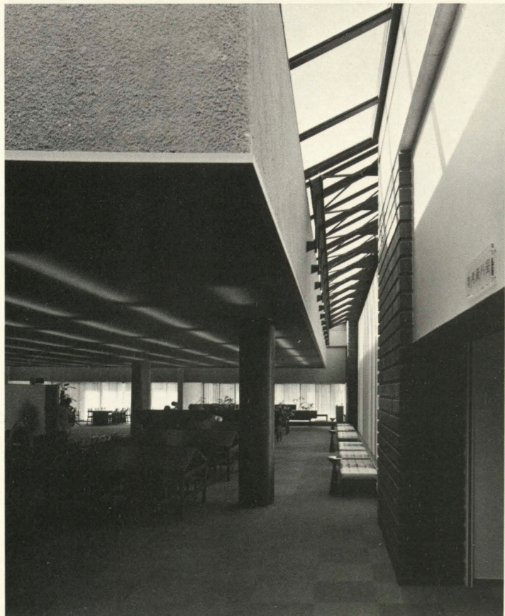
西側軽読書コーナー Magazines corner.