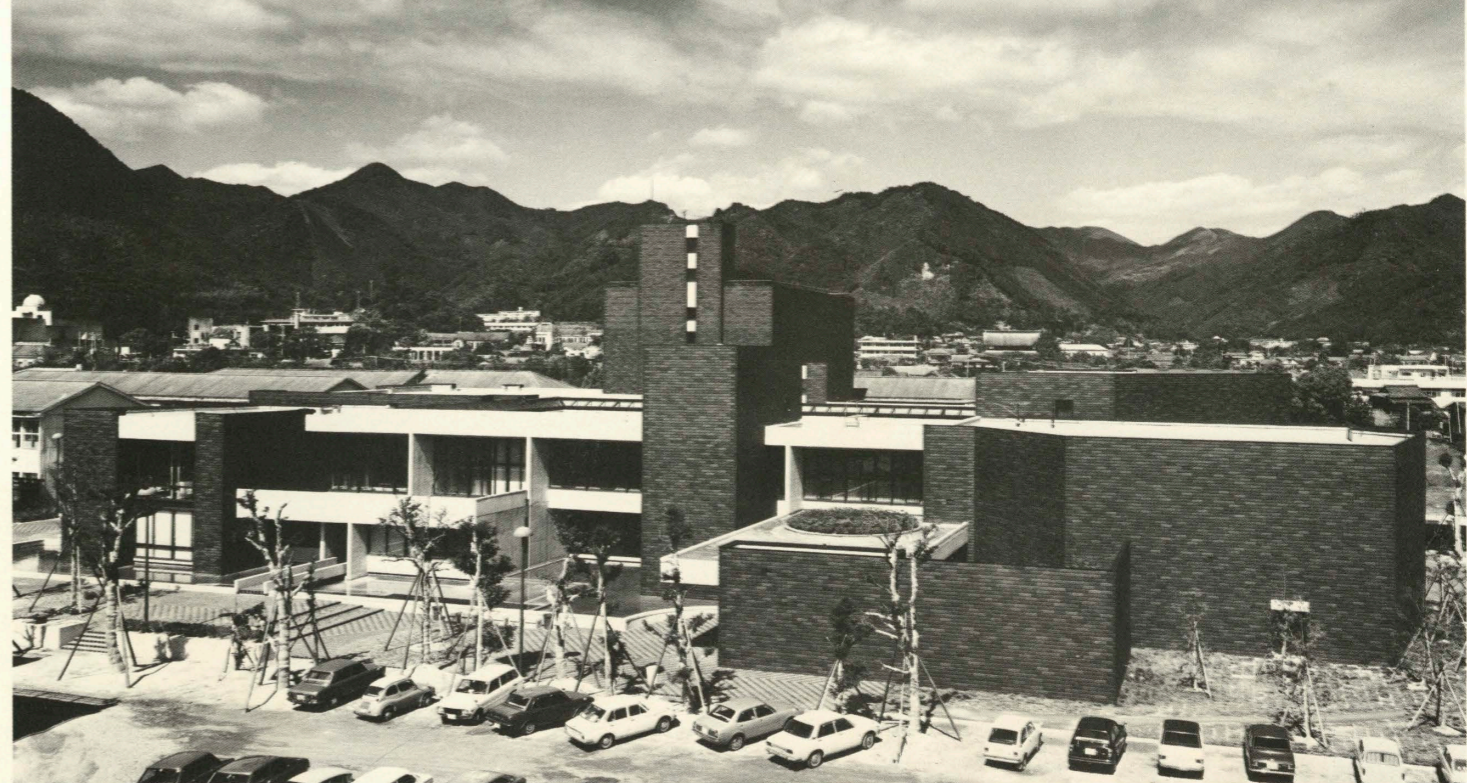
南側外観 South side view.