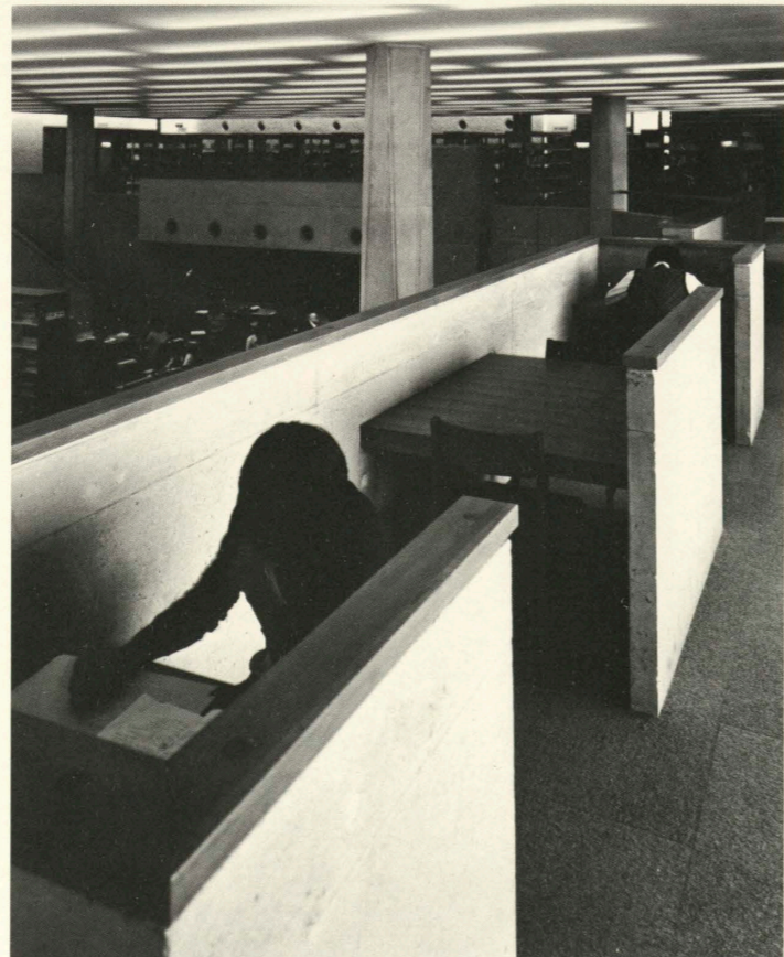
読書コーナー Reading corner.