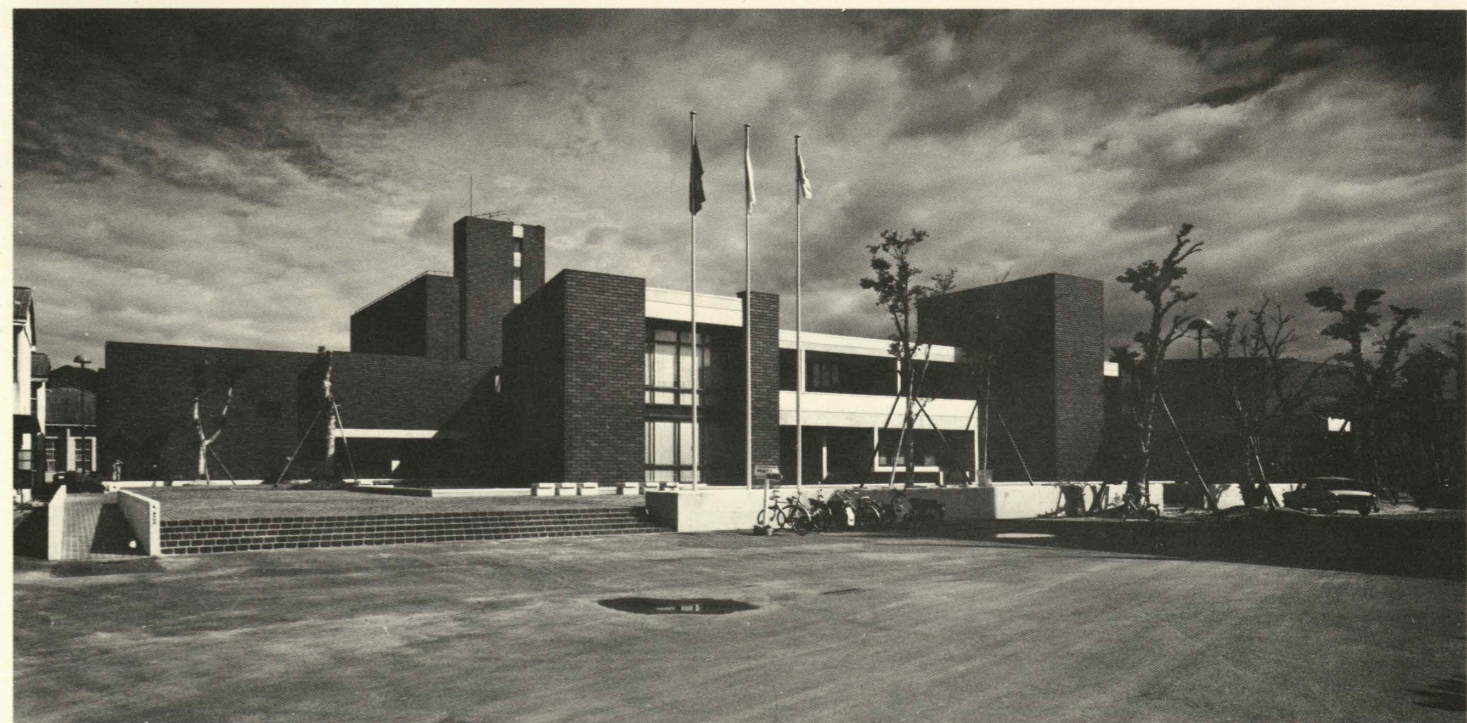
南側外観 South side view.