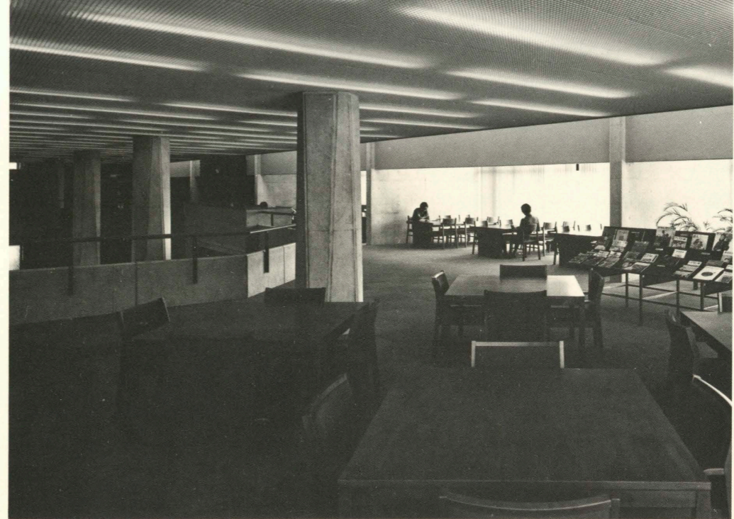
西および南側読書コーナー West and south reading rooms.