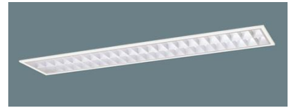
UGR19を確保する場合の器具例