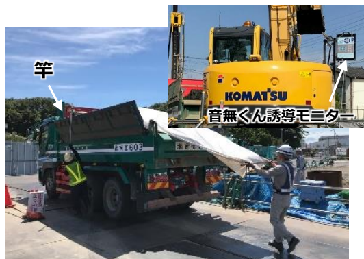
写真4：地上シート掛け(左)と音無くん

ダンプ運搬時の荷こぼれ対策とした荷台シート掛け作業は、創意工夫(竿とゴム紐)によって地上から直接可能な方法を採用し、墜落リスクを回避しました。また、閑静で狭隘な場所での積込作業もあることから、クラクションによる合図騒音や誘導員の挟まれ災害防止のため、ダンプとバックホウ運転者をFMラジオ音声でつなぎバック誘導ができるシステム「音無くん」を採用しました。