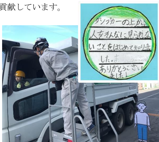
写真6：ダンプ運転席からの死角体験

地域住民の現場見学会(2023年10月時点で約5千人)のなかで、地元の保育園児から小中学生を対象に現場体験学習を開催しています。その中にはダンプに乗車して場内を移動し運転席からの景色や死角を体験してもらうことで、地域住民の安全活動に貢献しています。