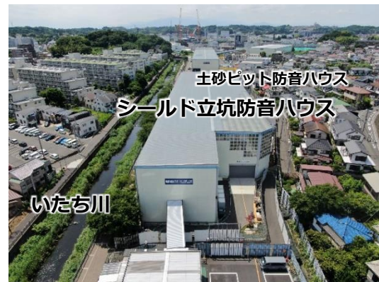
写真 1：シールド作業基地ドローン撮影