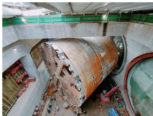
写真7：シールド機の引抜・回転作業

今後とも日本建設業連合会公衆災害対策委員会をはじめ関係者の皆様には一層のご指導ご鞭撻を賜りますようよろしくお願い申し上げます。