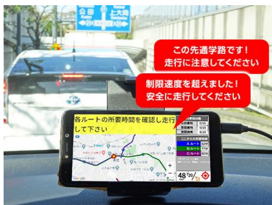
写真2：スマート G-Safe スマホ画面

自社開発した車両運行管理システム「スマート G-Safe」を運用しています。このシステムは、すべてのダンプにスマートフォンを設置し、走行中車両の安全管理や運行管理をリアルタイムに行うものです。速度監視・ハザードマップと連携した警告・走行中の注意喚起といった安全管理に加え、車両の位置・到着時間の把握や、運行管理者と運転者の双方通信などによる健康管理等も可能なシステムです。さらに、狭隘な道路におけるすれ違い管理、出来高管理の自動化、運行実績データの見える化・分析による運行計画の最適化など、作業効率の向上、働き方改革への取組としても有効です。