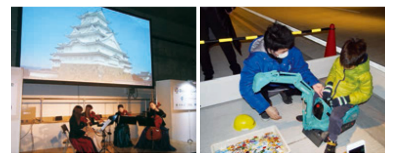
本邦初公開のトンネル内弦楽四重奏 ショベルカーゲームで遊ぶ子ども