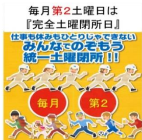
三井住友・深松・石堂JV 石巻合庁新築工事職長会