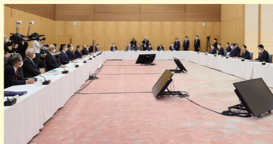
2021年12月27日転嫁円滑化会議