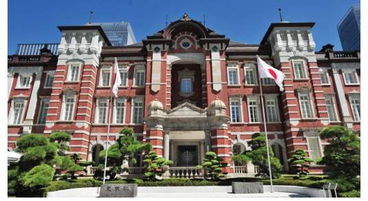
東京駅丸の内駅舎

1854年（嘉永7年）、唐津城下裏坊主町に生まれる。1871（明治4）年に唐津藩洋学校耐恒寮に入寮、高橋是清に学ぶ。工部大学校造家学科ではジョサイア・コンドルに西洋建築を学び、首席で卒業。ロンドン留学を経て工部大学校教授に就任、造家学会（のちの日本建築学会）を設立、国家を代表する建築を次々と手がけた。赤煉瓦に白色のストライプが映える外観は「辰野式」と呼ばれた。代表作は日本銀行本店（1896年竣工、国重要文化財）、東京駅丸の内駅舎（1914年竣工、国重要文化財）など。