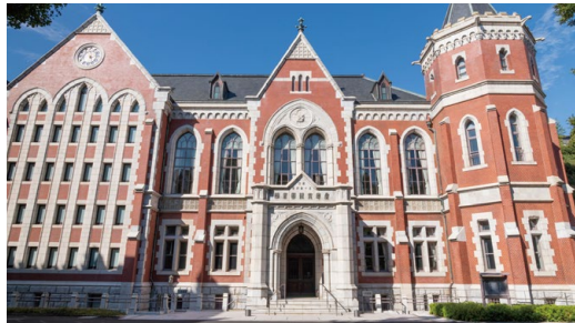
慶應義塾図書館旧館