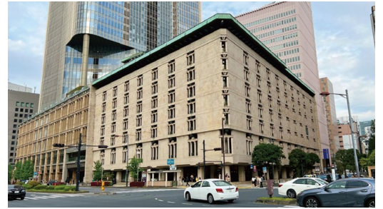
日生劇場（日本生命日比谷ビル）

1891年（明治24年）、東松浦郡満島村（現唐津市東唐津）に生まれ、幼少期を唐津で過ごす。1918（大正7）年に早稲田大学建築学科を卒業後、渡辺節建築事務所での修行時代を経て独立し、村野・森建築事務所を開設。森五商店東京支店（1931年竣工）を皮切りに、百貨店やオフィスビルなどの商業建築、教会・寺院などの宗教建築、官公庁などの公共建築など、多岐にわたる建築を手掛けた。代表作は、世界平和記念聖堂（1954年竣工、国重要文化財）、日生劇場（日本生命日比谷ビル、1963年竣工）など。