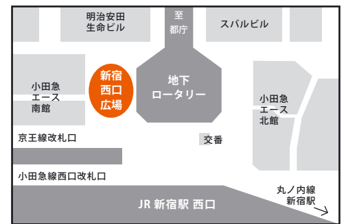
[アクセスマップ] 新宿西口地下周辺地図

詳しくはこちらをご覧ください。 http://committees.jsce.or.jp/day/