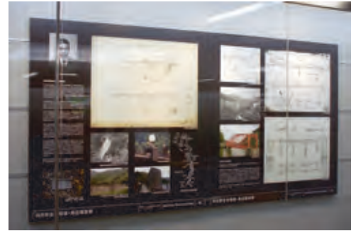
[昨年度の様子] 展示パネル