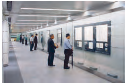
[昨年度の様子] 行幸地下ギャラリー