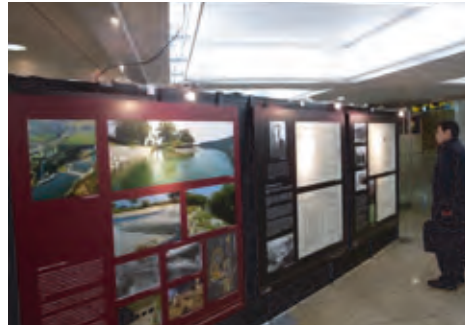
[昨年度の様子] 新宿西口イベント広場