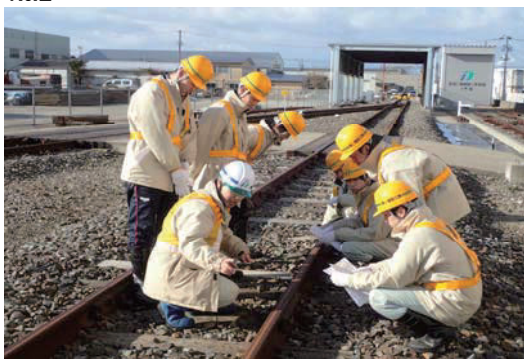
インターンシップの受け入れ