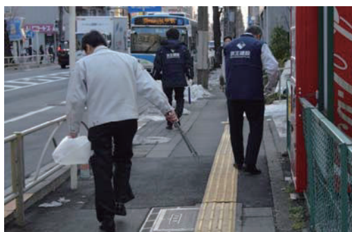
毎週木曜日、朝の清掃