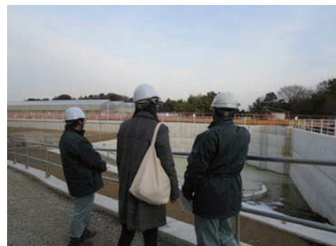
インターンシップの受け入れ