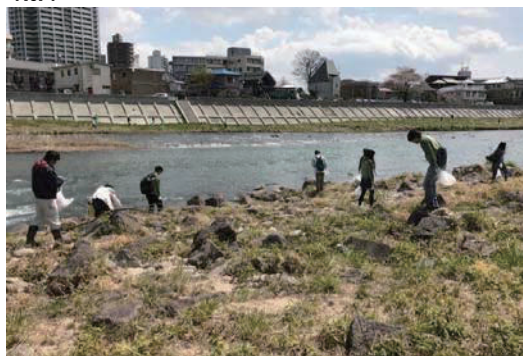
広瀬川1万人プロジェクトに参加