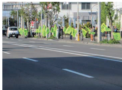
交通安全街頭啓発運動