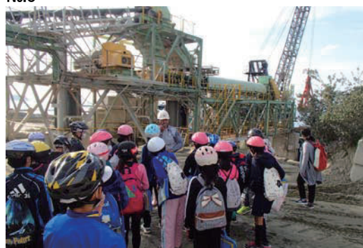
砕石工場見学会の開催