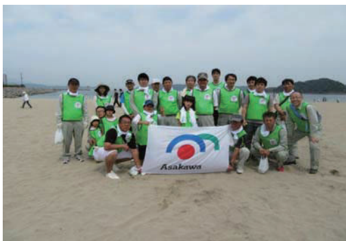
リフレッシュ瀬戸内の清掃活動