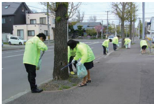
桑園地区清掃活動