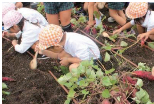
本社ビル 屋上芋ほり