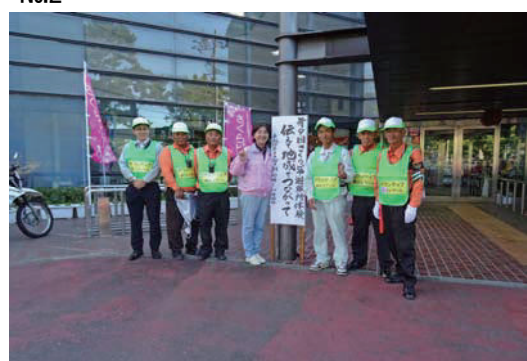
避難所体験ボランティア