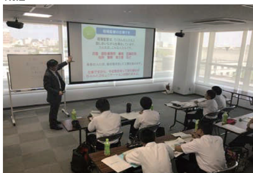
地元中学校3年生の会社訪問