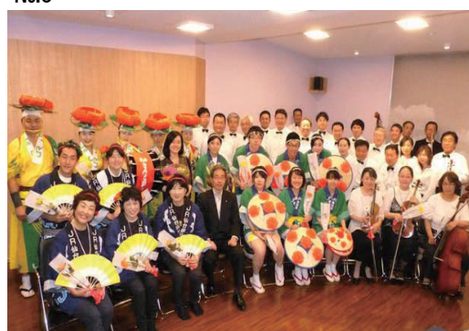
「ハナミズキ2-13」での活動風景