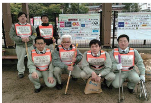
エキキター一斉清掃