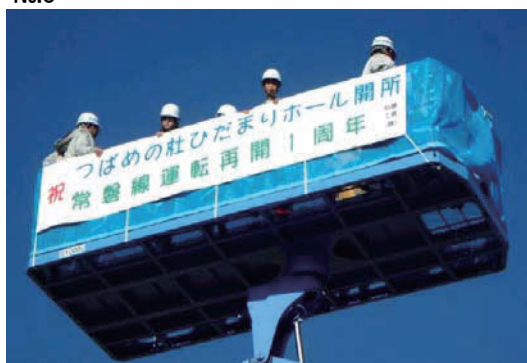
つばめの杜ひだまりホール開所記念