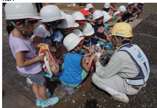
ドローンに触れる子どもたち