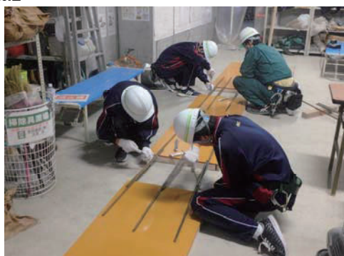
中学生の職場体験学習