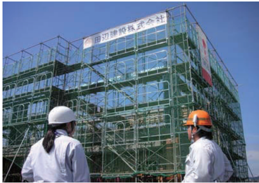
インターンシップの受け入れ