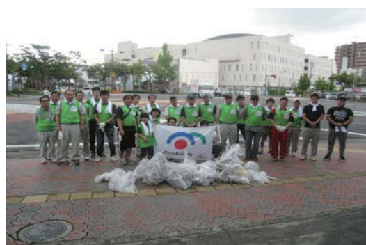
紀州路クリーン大作戦の清掃活動