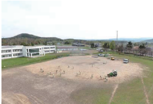
当麻中学校のグラウンド整備