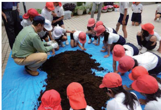
カブトムシ幼虫の寄贈風景