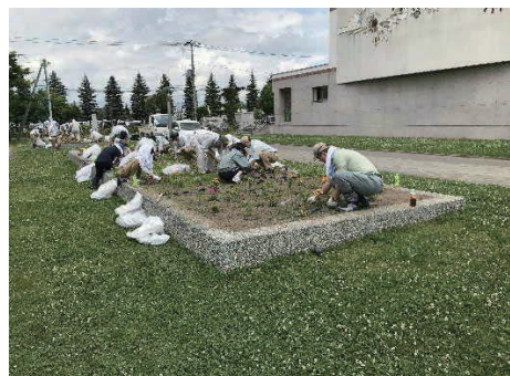
中学校の花壇・畑の草刈・整備