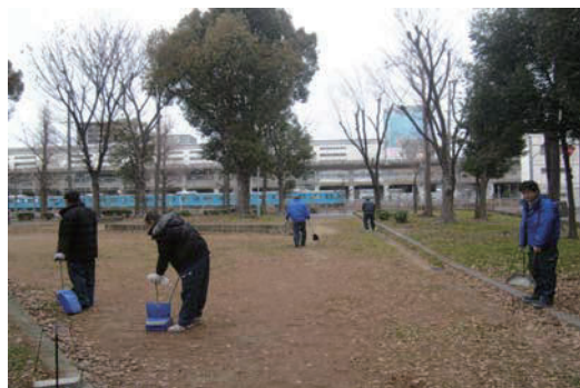
大阪地区清掃活動