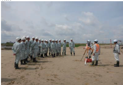
地元工業高校3年生の現場見学会