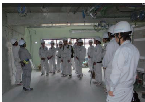
1 D a y インターンシップ