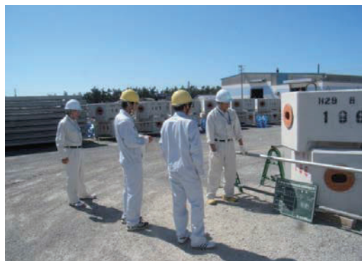
インターンシップの実施