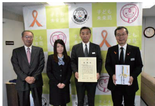
交通遺児に対する義援金の贈呈