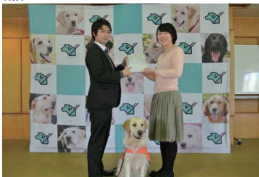
日本盲導犬協会への寄付を実施