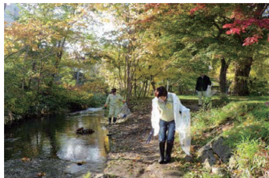
札幌市豊平区とのアダプト活動