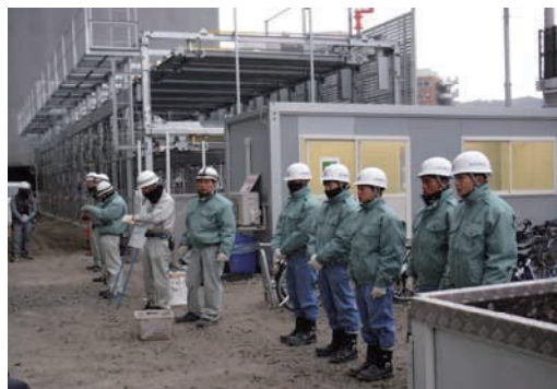
就業体験（インターンシップ）