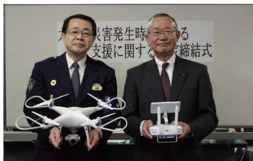
ドローンを活用した災害時支援