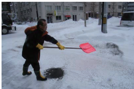
交差点、歩道への砂撒き