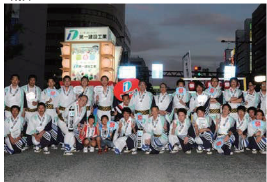
新潟まつり大民謡流しに参加