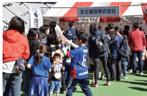
京王駅伝フェスティバル2017