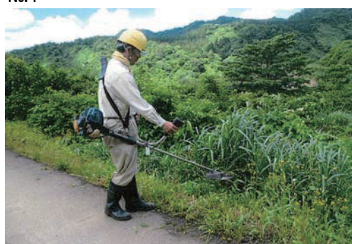
棚田保全活動の草刈り作業