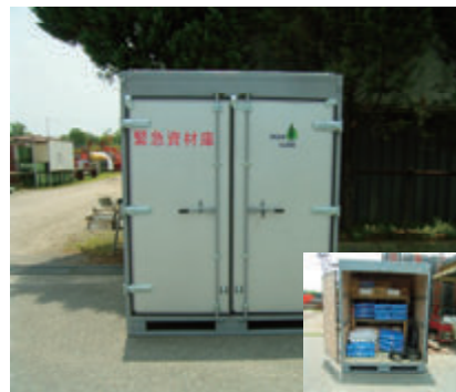
活動名:No.4 緊急資材倉庫