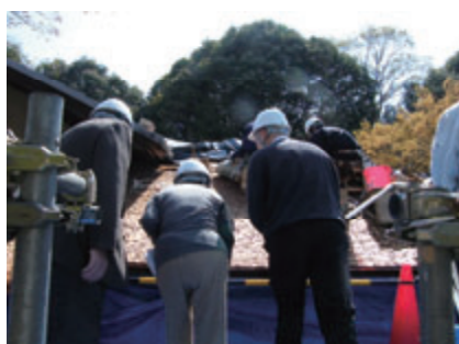
活動名:No.4 檜皮葺き見学会