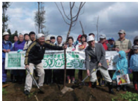
活動名:No.5 里山の再生をめざして