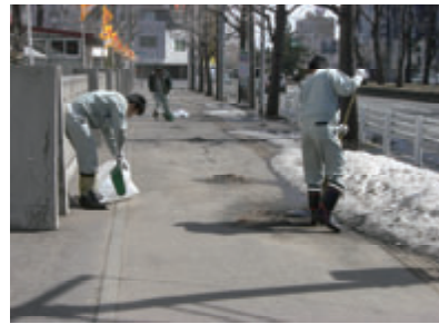
活動名:No. 3 道路等の清掃活動