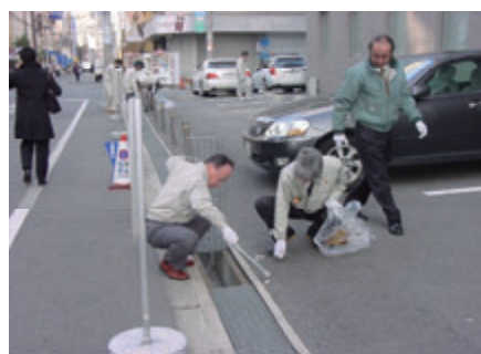
活動名:No.4 地域清掃活動