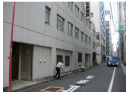
活動名：No.2会社周辺道路・歩道の清掃活動