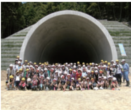
活動名:No.2 気山トンネル／舞鶴若狭自動車道