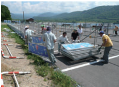
活動名:No.3(トライアスロン大会)