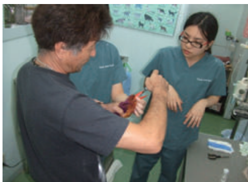
活動名:No.2 絶滅危惧種「琉球ショウビン」保護