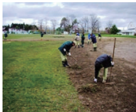
活動名 : No.2 北海道当麻町立当麻中学校 グラウンド整備