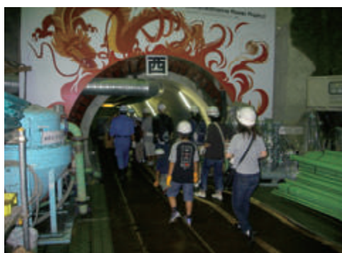
活動名:No.3現場見学会