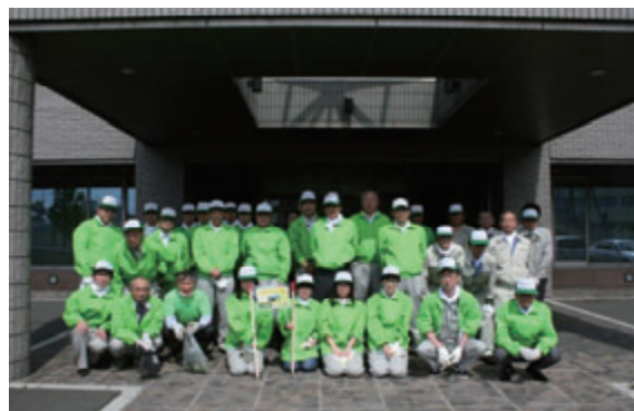
活動名：No.3 創成川通美化推進の会活動