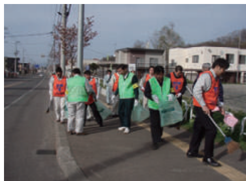
活動名:No.3 札幌市西区アダプトプログラム 事業参画