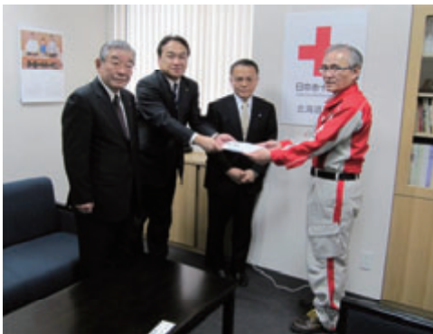
活動名：No.2 東日本大震災被災地に対する義援金を寄付