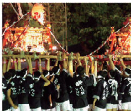
活動名:No.1生國魂神社夏祭り