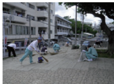
活動名:No.5 岡野自治会大掃除