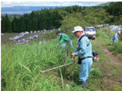
活動名:No.3 「水土里ネットの森」