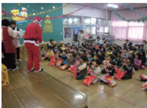
活動名:No.3保育園のクリスマスへ参加