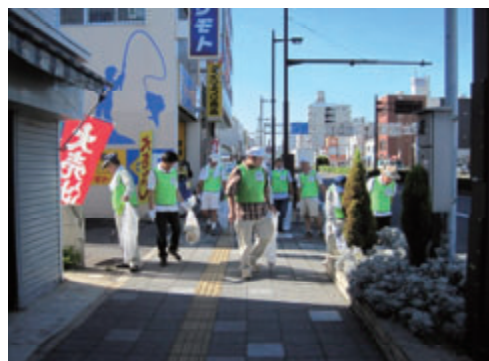
活動名:No.3 紀州路クリーン大作戦‘10