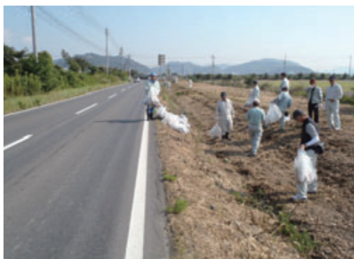
活動名:No.1笠岡湾干拓地清掃活動