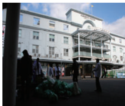
活動名:No.3 おもてなしクリーン作戦