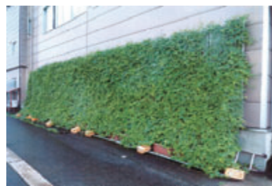
活動名:No.5 ゴーヤ緑のカーテン