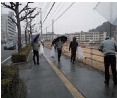
活動名 : No.4 広島市まちの美化に 関する里親制度