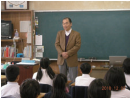
活動名:No.2キッズISO 14000プログラム