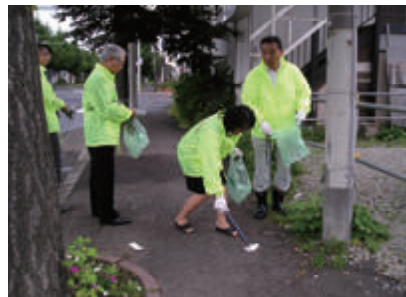
活動名:No.2社屋近隣の清掃活動