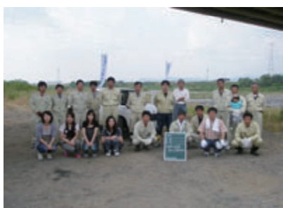
活動名:No.2 揖斐川クリーン作戦