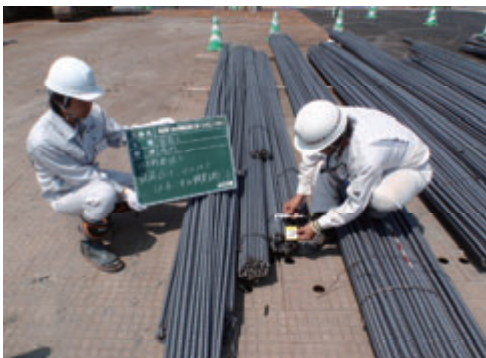
活動名:No.2 インターンシップ生受入