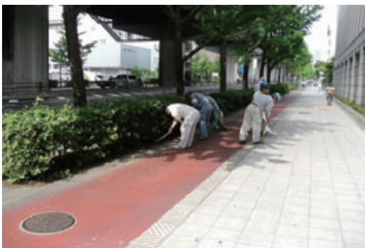
活動名:No. 4作業所周辺環境の整備