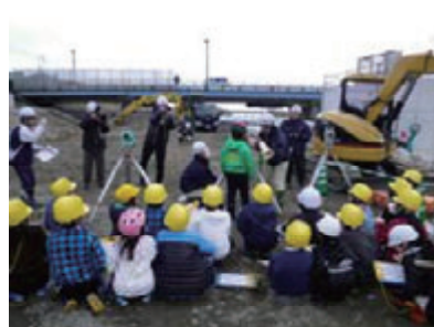
活動名:No.5 工事見学会