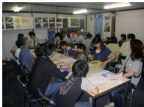
活動名:No.3現場見学会