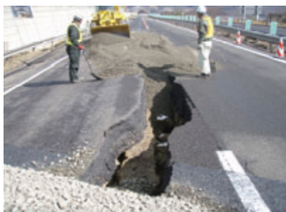
活動名:No.1 東日本大震災復旧工事