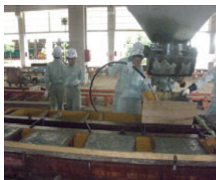
活動名:No.2 職業体験学習