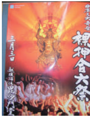
活動名:No.2浦佐裸押し合い大祭