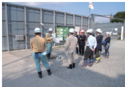
活動名:No.2現場見学会による工事説明