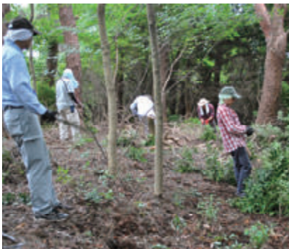
活動名:No.1 里山保全活動