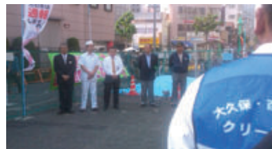
活動名:No.3 新宿防犯協会加入