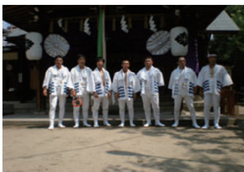
活動名:No.1住吉祭りへの参加