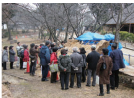
活動名:No.4 茅葺き体験