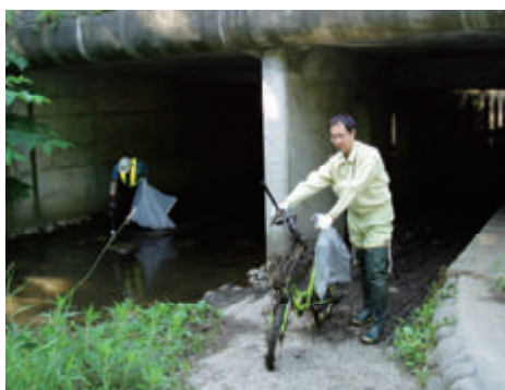
活動名 : No. 1 北海道空知総合振興局 アダプトプログラム