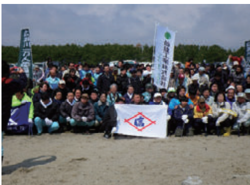
活動名:No.1広瀬川1万人プロジェクト