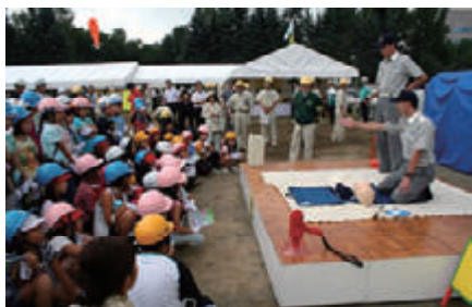
活動名:No.1地域住民参加型防災訓練