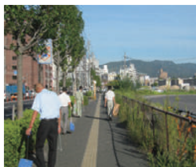
活動名 : No.4 広島市まちの美化に 関する里親制度