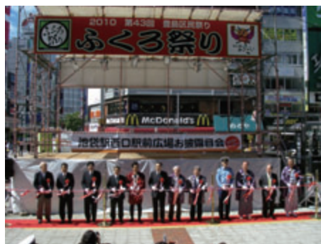
活動名 : No.2「ふくろ祭り」に協力