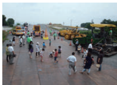
活動名:No.3 佐久JCT現場見学会