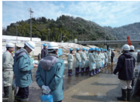
活動名:No.3 現場見学会実施