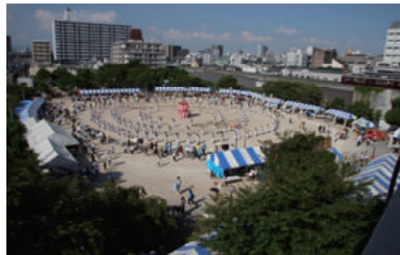
活動名:No.5各地域コミュニティへの協力、参加