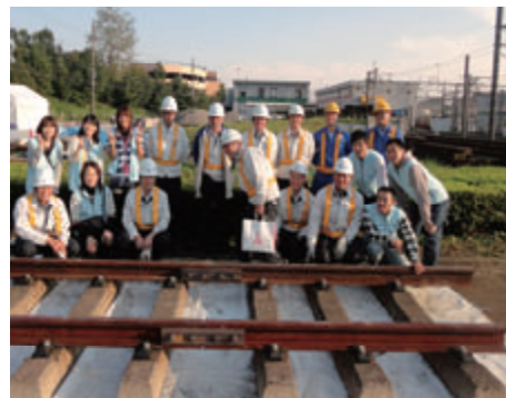
活動名:No.2 若葉台車両基地一般開放