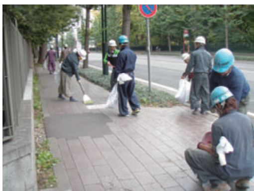
活動名:No.1 作業所周辺の清掃活動