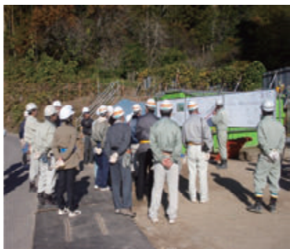
活動名:No.1現場見学会