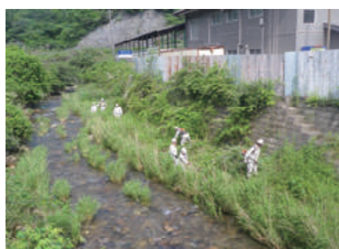
活動名:No.4ラブリバーへの参加