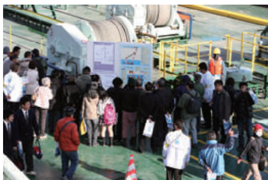
活動名:No.2 大型起重機船「洋翔」の一般公開