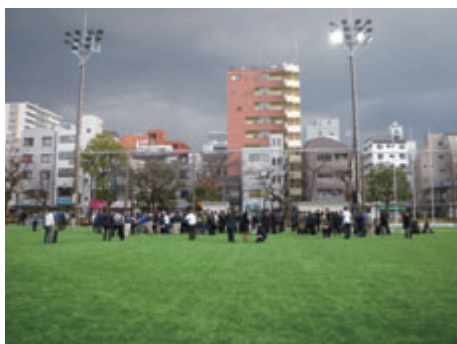
活動名 : No.1 東日本大震災発生時施工現場を緊急避難場所として開放