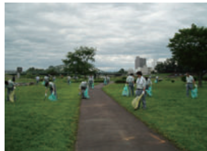
活動名:No.4(河川敷清掃ボランティア)