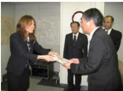
活動名:No.1交通遺児義援金活動