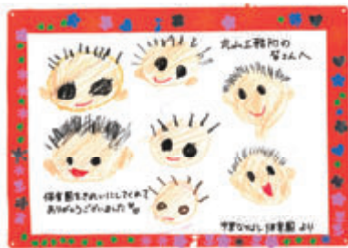
活動名:No.2 地域貢献ボランティア