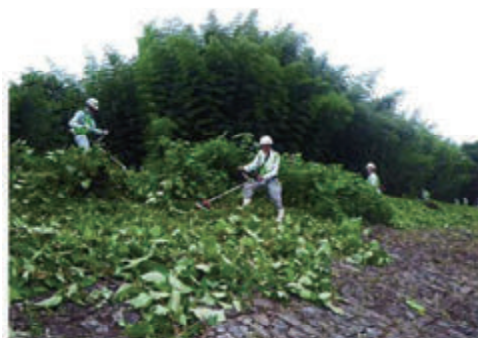
活動名:No.5 草刈・清掃奉仕作業