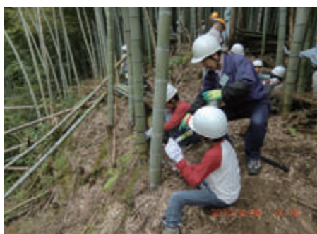
活動名:No.3 里山保全ワーキングホリデー