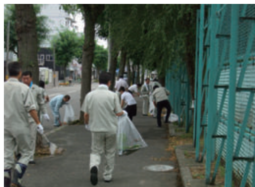
活動名:No.5 アダプト制度による清掃活動