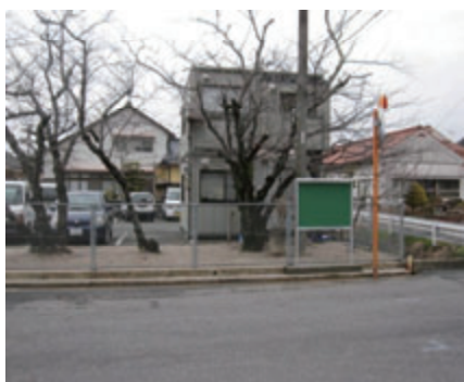
活動名:No.2 地域との情報共有