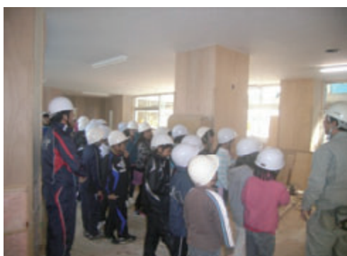
活動名:No.2 現場見学会