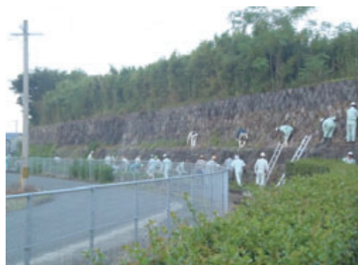
活動名:No.2国指定文化財・旧玉名干拓施設 草刈清掃活動