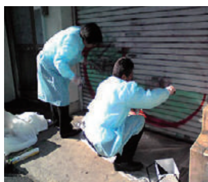
活動名:No.5新宿区「ポイ捨て防止・路上喫煙禁止キャンペーン」への参加