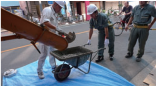
活動名:No.2 インターンシップ受入