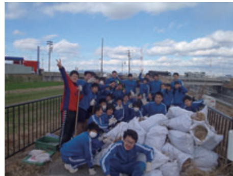
活動名:No.3除草プロジェクト