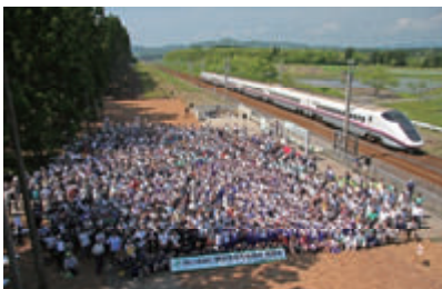
活動名:No.1 神宮寺2号鉄道林植樹式