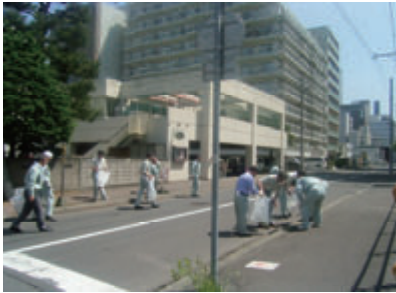
活動名:No. 2 道路等の清掃活動 及び活動支援