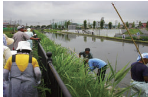
活動名:No.3 第二大場川一斉清掃