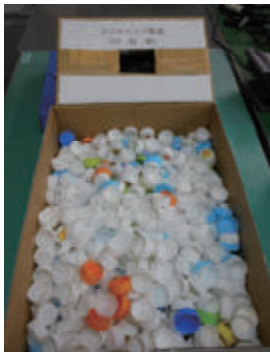
活動名：No.1ペットボトルキャップ収集・寄付