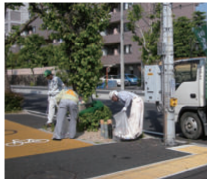
活動名:No.3 清掃活動への参加