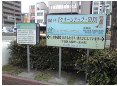
活動名:No.1 ボランティア・サポート・プログラム 活動名:No.1 ボランティア・サポート・プログラム