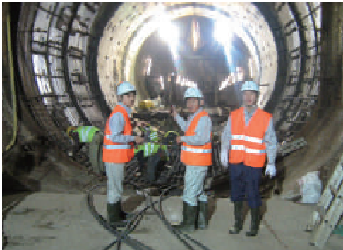
活動名:No.1「海外インターンシッププログラム」に協力