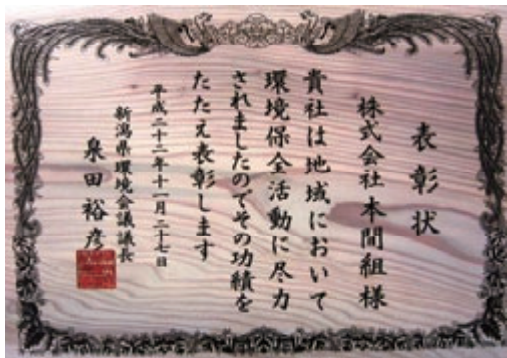
活動名:No.1 平成22年度新潟県環境賞受賞