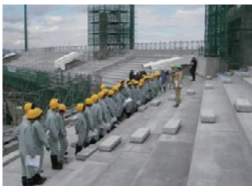
活動名:No.3 高校生の現場見学会