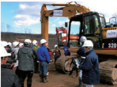
活動名: No.8 災害復旧時無線操縦「ロボQ」見学会