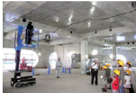
活動名: No.5 武蔵野プレイス作業所 小学生対象の見学会