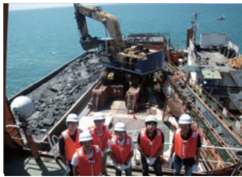
活動名:No. 6 工事現場見学会(山口大学)