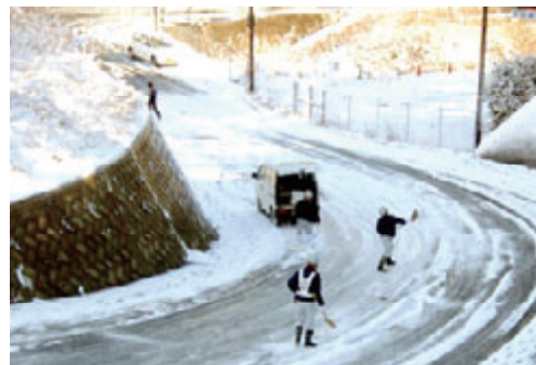
活動名: No.10 道路除雪で渋滞解消に協力し感謝状を受ける