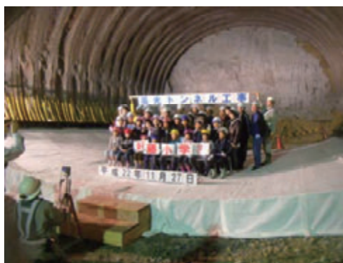
活動名:No.4 現場見学会(愛媛県宇和島市)