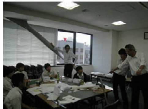
活動名:No.4 日本橋中学校職場体験(東京支店)