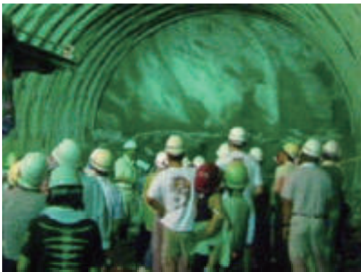
活動名:No.3 トンネル現場見学会