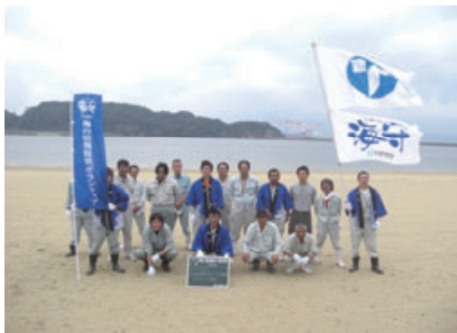
活動名:No. 8 海守清掃活動(伊万里)