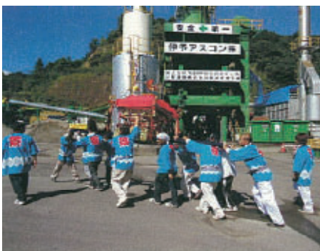
活動名:No.4 地域のイベント(今治市)