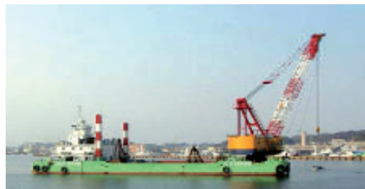
活動名:No.10 小名浜港啓開作業 「2001テトラ号」を小名浜港へ投入