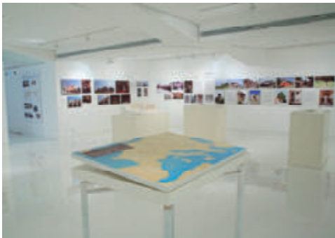
活動名:No.6「ギャラリー・タイセイ」の運営