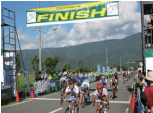
活動名:No.1 自転車(ツールド北海道)