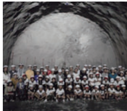
活動名:No. 8 現場見学会開催、周辺の方々と一緒にいろいろなイベント開催