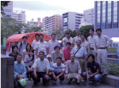
活動名:No.1 中央区防災訓練