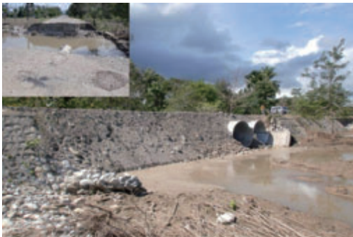
活動名:No.1 被災した道路の復旧(海外)