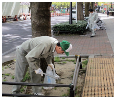
活動名:No.5 仙台まち美化サポートプログラム