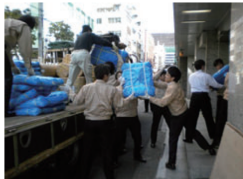
活動名:No.3 震災被災地への支援物資の送付