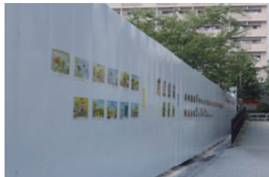
活動名:No.9 現場仮囲のイメージアップ