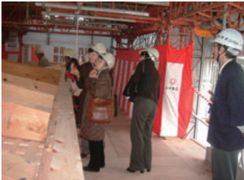
活動名:No.3 東長寺五重塔一般公開