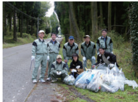
活動名:No.5「阿蘇水土里・クリーン作戦」に参加