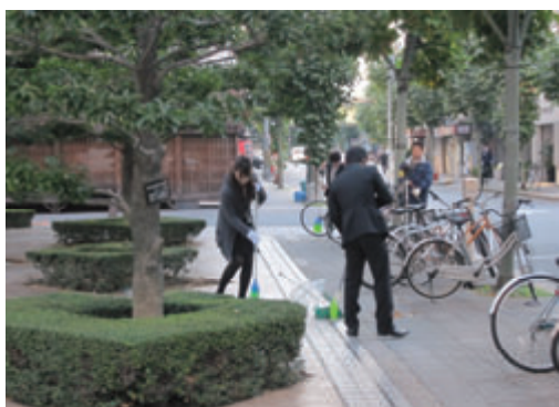
活動名 : No.8クリーンおおさか2010に参加