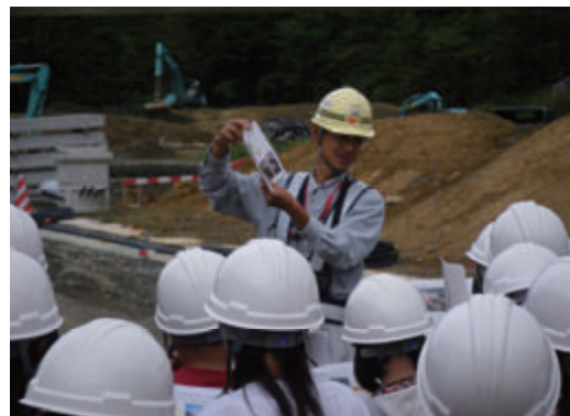
活動名:No.4 現場見学会