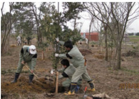
活動名:No.6「グリーン・アース河北潟」に参加