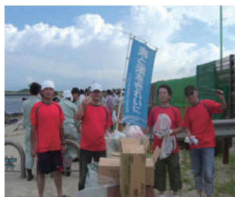
活動名:No.5 酒田港クリーンアップ