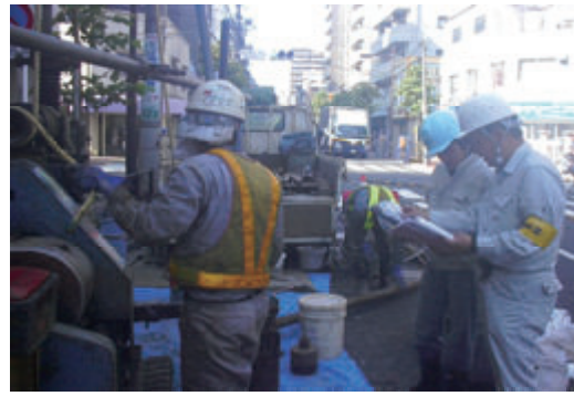
活動名:No.2 インターンシップ教育の受入れ