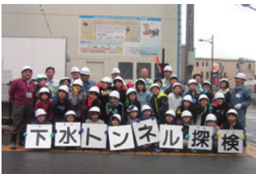
活動名:No.6 現場見学会の開催