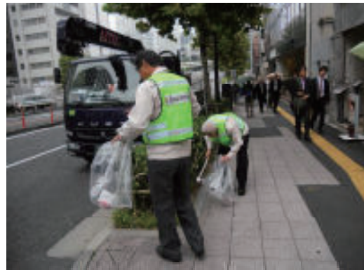
活動名:No.4 地域の清掃活動