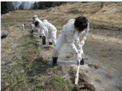
活動名:No.5 田んぼ畦づくりボランティア