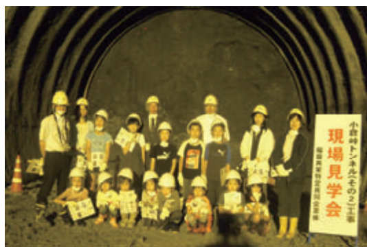
活動名 : No.5 現場見学会