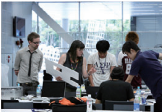
活動名:No.5 AAスクール企画展にて コミュニケーションを図る学生たち