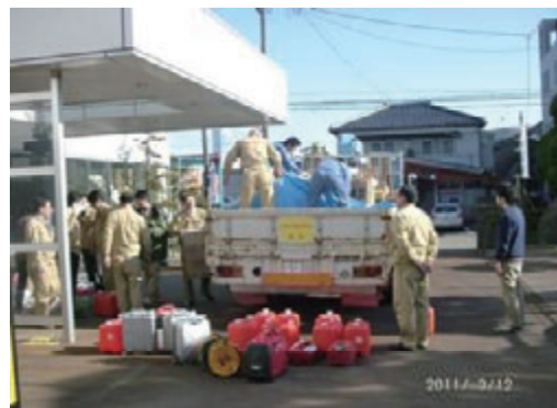
活動名:No.10 東日本大震災支援活動