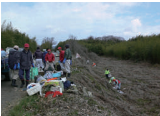
活動名:No. 5 河川清掃作業への参加・協力