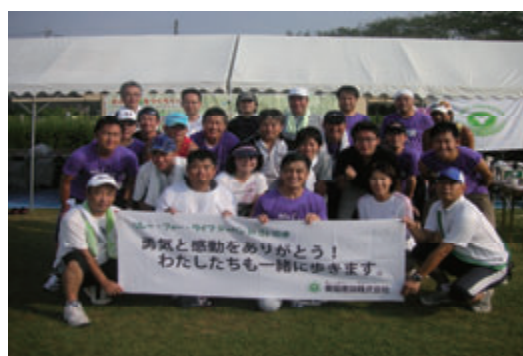
活動名:No.8 「リレー・フォー・ライフ」への協賛・参加