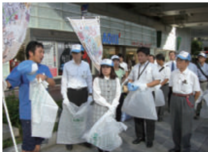
活動名:No.1「はな街道」への ボランティアへ参加