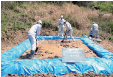
活動名: No.1 谷田大池で希少植物「タコノアシ」を保護