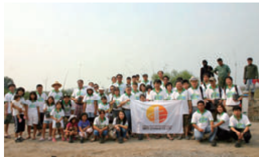
活動名:No. 4 マングローブ植樹