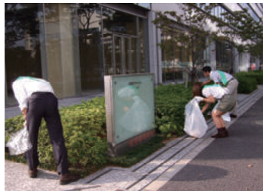
活動名:No.6 クリーン活動