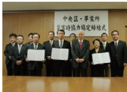
活動名:No.8 災害時協力協定締結