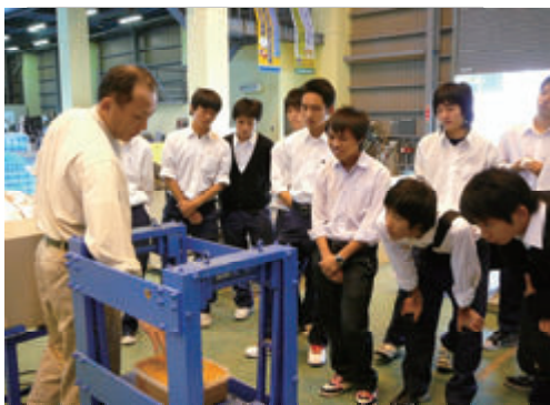
活動名:No.1インターンシップ生の受け入れ