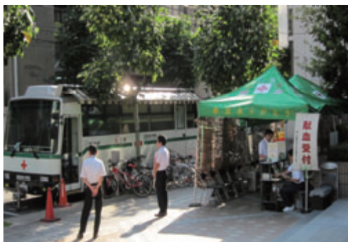
活動名 : No.3献血に協力