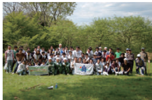
活動名:No.7「東京グリーンシップ・アクション」ボランティア研修