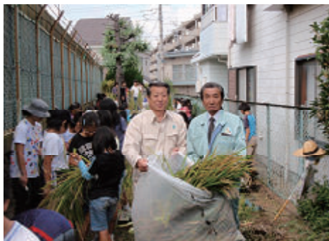
活動名:No.1 生物多様性教育(稲刈り)