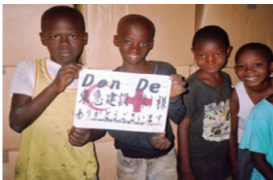
活動名:No.1 マリ共和国への衣料提供