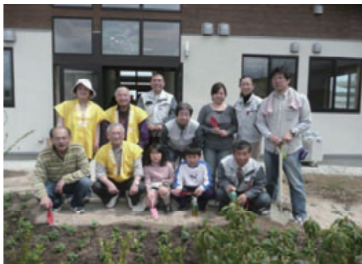
活動名:No.2「子どもの村福岡」植樹祭