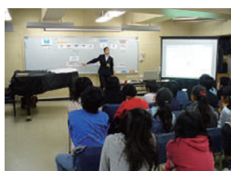
活動名:No.9 環境教育の実施