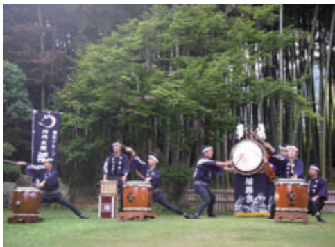
活動名 : No.3 万代太鼓福鵬会