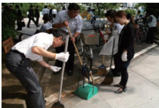
活動名:No.7 地域清掃活動