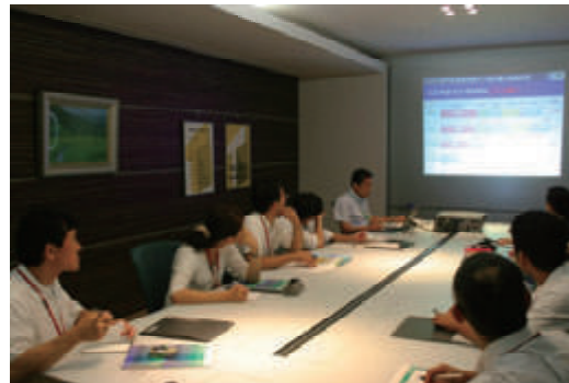
活動名:No.5「教員の民間企業研修」に協力