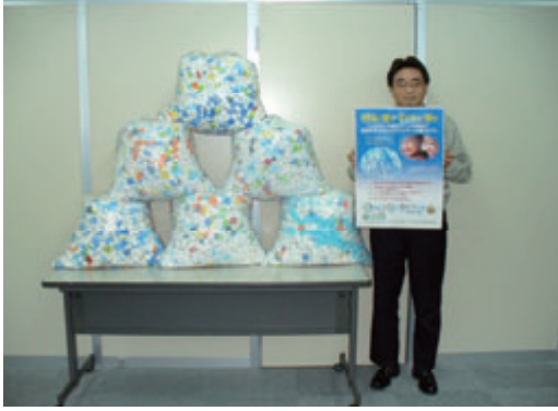
活動名: No.1 エコキャップ運動