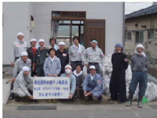
活動名:No.4 東日本大震災災害支援活動