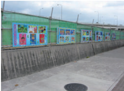
活動名: No.5 工事用のフェンスに地元 小学校児童の絵画を展示