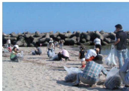
活動名:No.9 皆生海岸の清掃活動