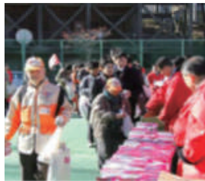
活動名:No.2 四ッ谷駅周辺地区帰宅困難者対策地域協力会参画