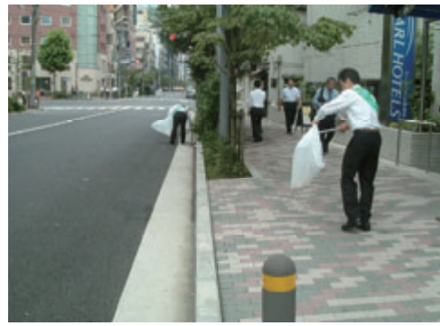
活動名:No.1 社屋周辺の清掃2