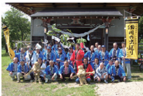
活動名:No.7 地元祭り・虫送りに参加