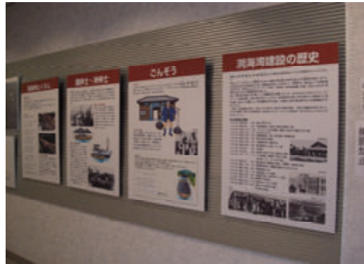
活動名: No.6 わかちく史料館が 写真展を開催