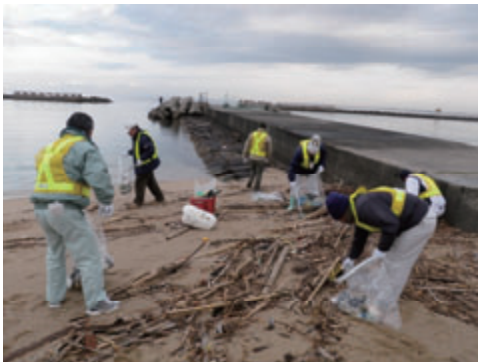
活動名:No.1「淡輪ときめきビーチ」の 清掃活動を実施