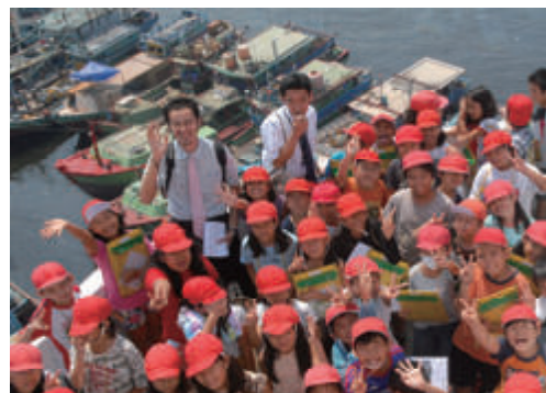
活動名:No.7 ジャカルタ日本人学校社会科見学