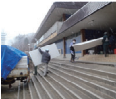
活動名:No. 1 東日本大震災への対応