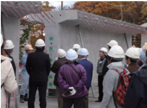
活動名:No.5 工場見学・体験学習