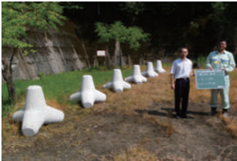
活動名:No.4 小学校へテトラポッドを寄贈