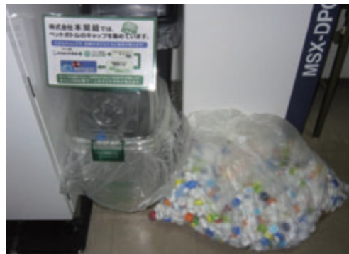
活動名:No.2 エコキャップ回収運動