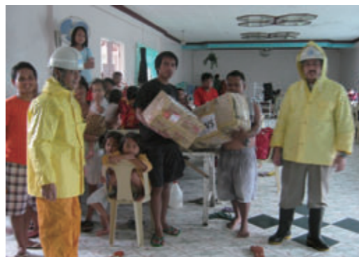
活動名:No.6 豪雨による避難民への支援物資寄付