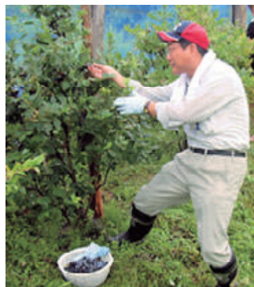
活動名:No.2 あおもり農業農村支援CSR活動