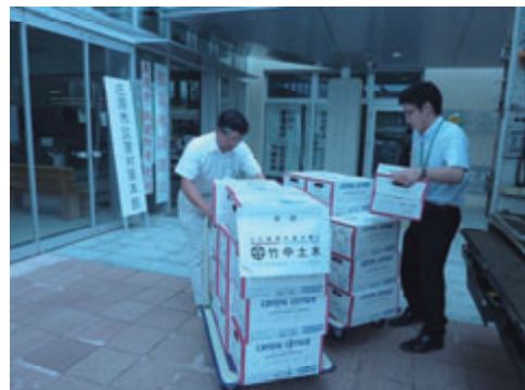
活動名:No.10 広島県庄原市へ災害物資を寄付