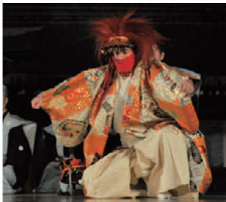
活動名:No.1「第29回明治神宮新能」奉納協賛