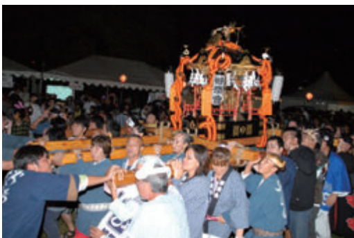
活動名:No. 3 秋祭りへの参加