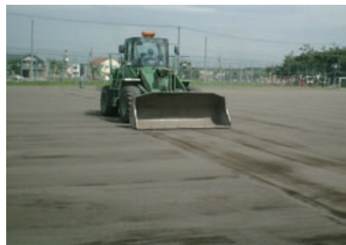
活動名:No.7 学校のグラウンド整備(北海道)