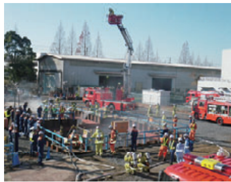
活動名:No.3 消防署の消防長査察訓練