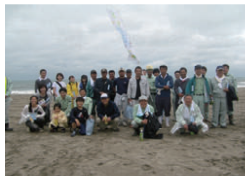
活動名 : No.7 海岸清掃