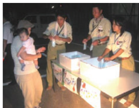
活動名 : No.9鶴見川花火大会観覧会