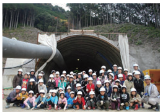
活動名:No.10 近隣の小学生による現場見学会