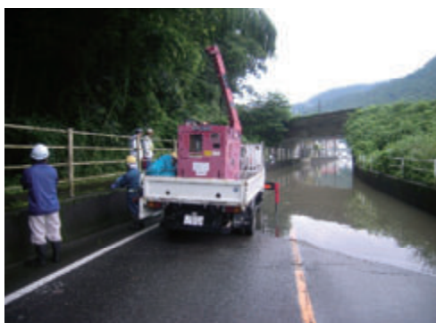
活動名:No.7 道路冠水復旧作業