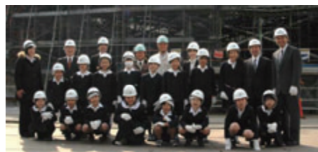
活動名:No.6「環境課外授業」を開催