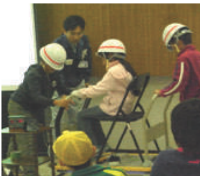
活動名:No. 5 土木の日に技術研究所を小学生に公開