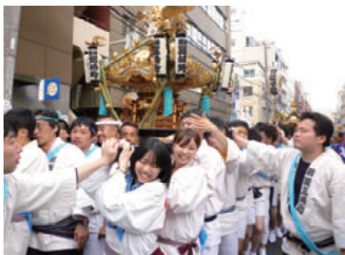
活動名:No.1 三崎神社例大祭への参加