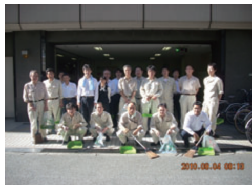
活動名:No.3 まち美化パートナー