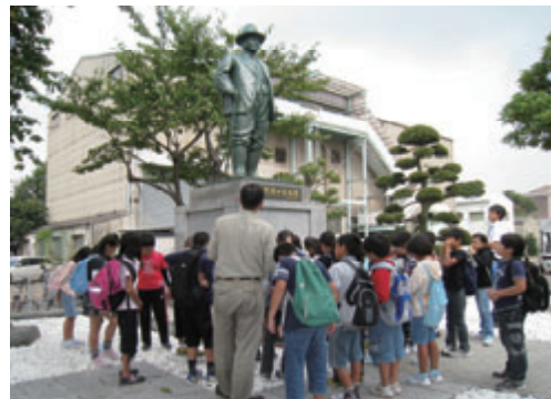
活動名:No.5 地元小学校の地域学習支援