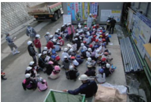
活動名:No.4 現場見学会の実施