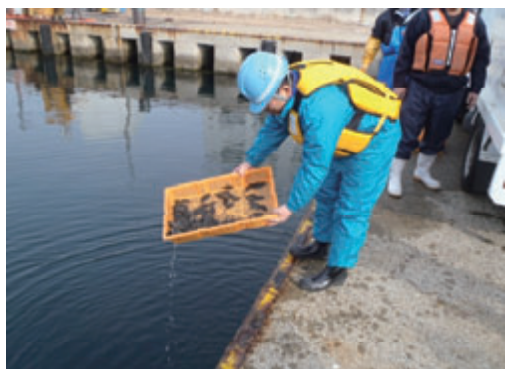
活動名:No.9 兵庫県垂水港にヒラメの稚魚放流