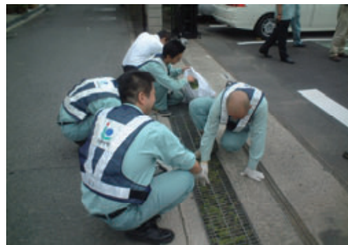
活動名:No.2 清掃・美化活動(大阪出張所)