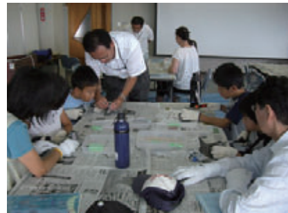
活動名:No.5みなとオアシス大洗夏休み特別企画 “みなと体験ツアーin大洗”への協力