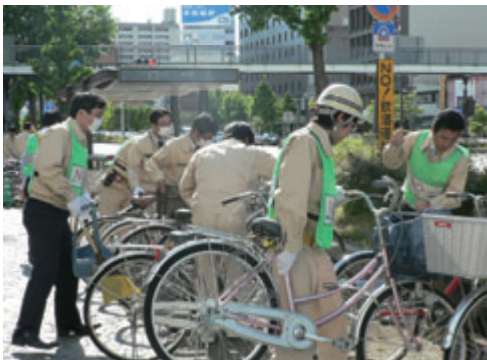
活動名:No.1 事業所周辺の清掃活動