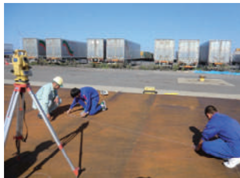
活動名 : No.4 中学生の職場体験