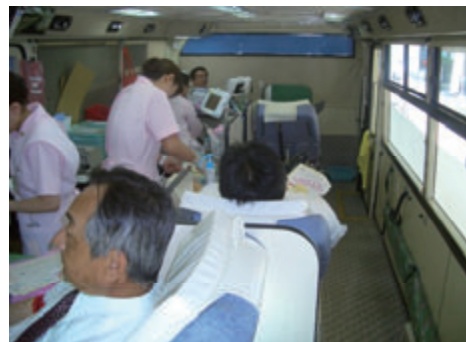
活動名:No.6 献血活動(関西支店)