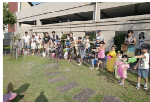
活動名 : No.6打ち水大作戦2010に参加