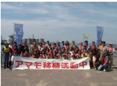
活動名:No.6 アマモ移植活動