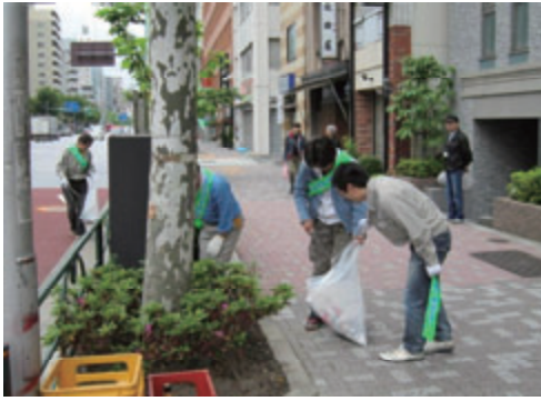
活動名:No.1 社屋周辺地域の清掃(本社)