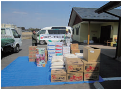
活動名:No.3 東日本大震災被災地への物資支援