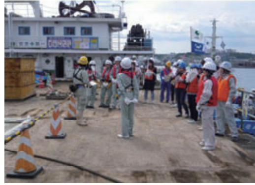
活動名: No.4 レディースパトロールの実施