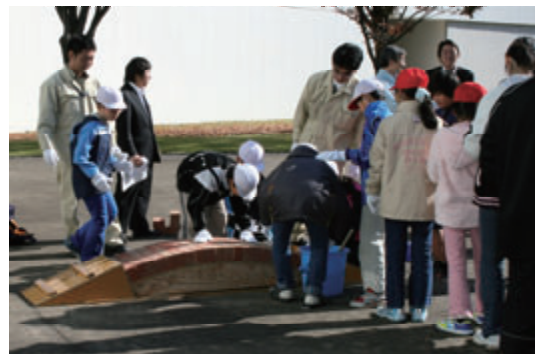
活動名:No.6 技術研究所見学における レンガアーチ橋製作体験