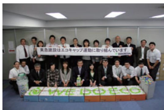
活動名:No.2 エコキャップ運動への協力