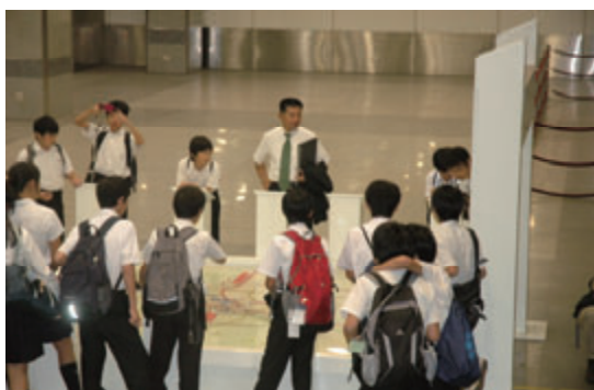
活動名:No.4 海外日本人学校の教育 カリキュラムに協力