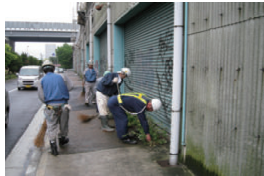
活動名:No.3 地域清掃活動