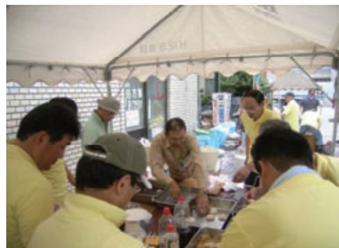
活動名:No.7 もちつき大会への協力