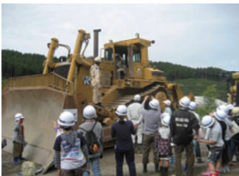
活動名:No.5 九木野尾ダム見学会