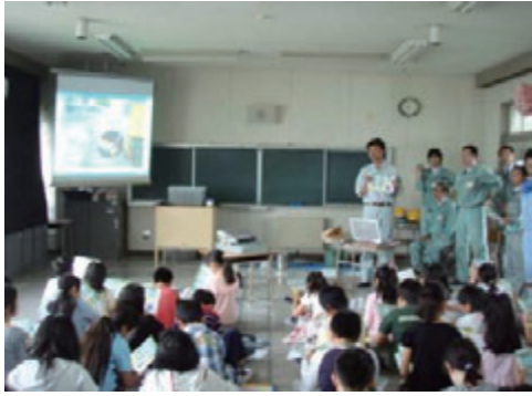
活動名:No.1 小学生対象の現場見学会