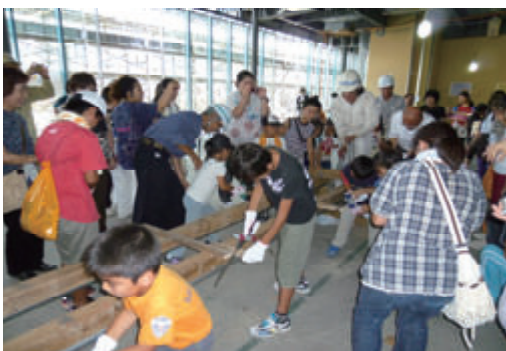
活動名:No.7 親子職場見学会