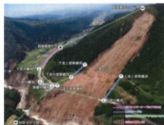
ネットワークシステム