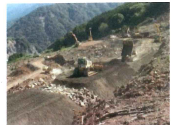
建設機械作業状況