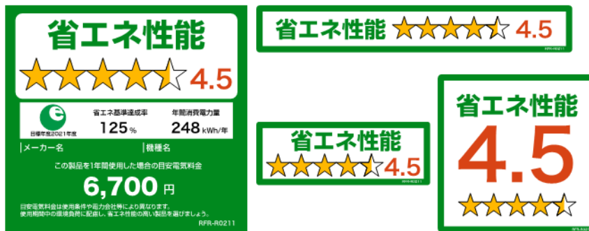
(冷蔵庫のイメージ)