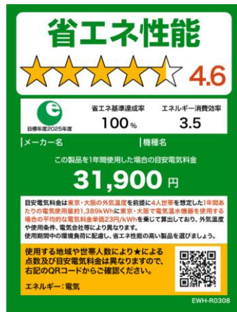
(電気温水機器のイメージ)

※ 照明器具、テレビジョン受信機、家庭用電気冷蔵庫、家庭用電気冷凍庫、温水機器及び電気便座については、2020年11月及び2021年8月に上記様式に変更済。今後、家庭用エアコンディショナーについても上記様式に倣ったものに変更予定。 なお、温水機器以外は、製品のサイズやネット取引等の限られたスペースで使用する場合は右側のミニラベルを活用すること。