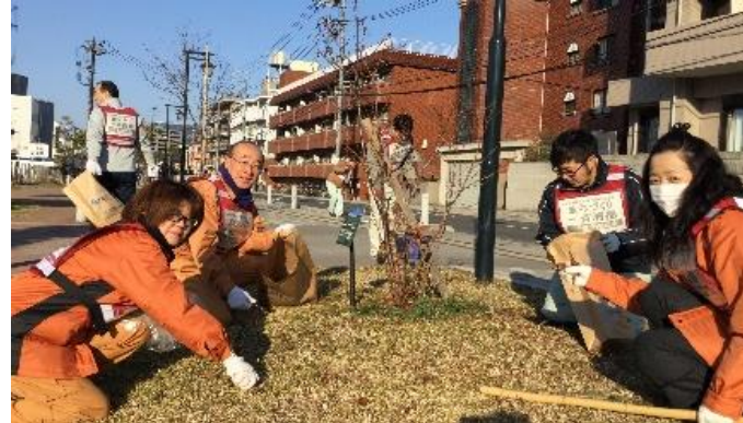
⑥現場周辺道路の清掃活動 (地域のボランティアの方と一緒に)