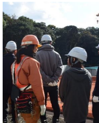
⑤女子大生インターン受入れや見学会での個別質問対応