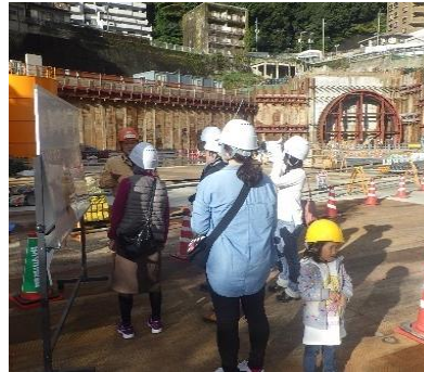
②親子見学会 (未来のけんせつ小町(?)がたくさん参加してくれています!)