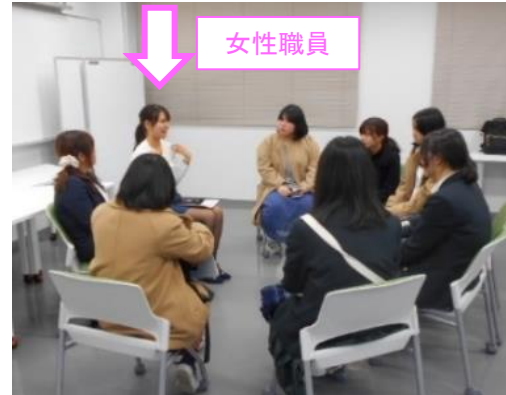
③近隣の工業系高専での女子学生向け交流会