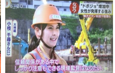
⑦メディアでの積極的なけんせつ小町活躍のアピール