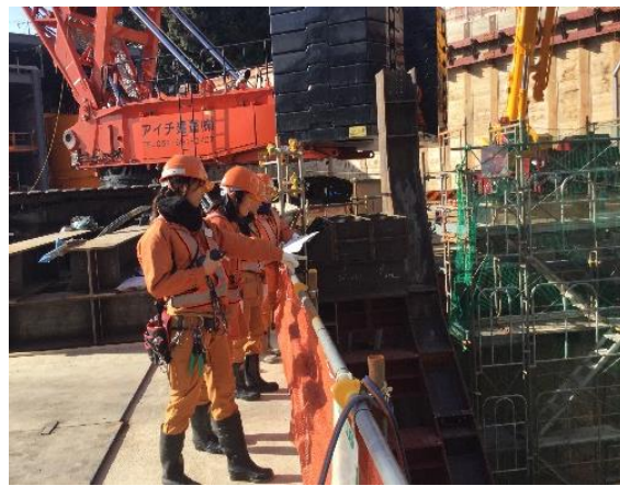
④月に一度の女性職員によるパトロール