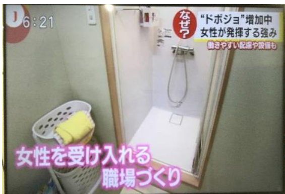
①女性職員の意見を取り入れた環境作り (↑女性専用シャワー室 →量部屋つき女性用更衣室)