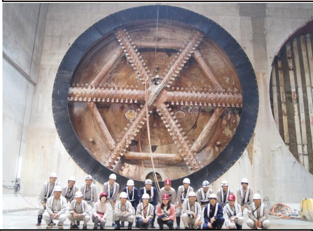
シールド到達記念撮影