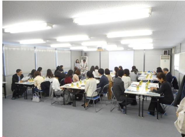
素敵女子の会現場見学