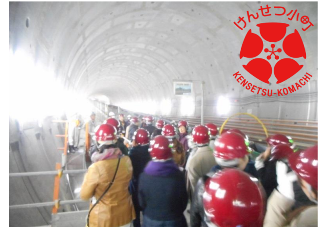
素敵女子の会現場見学