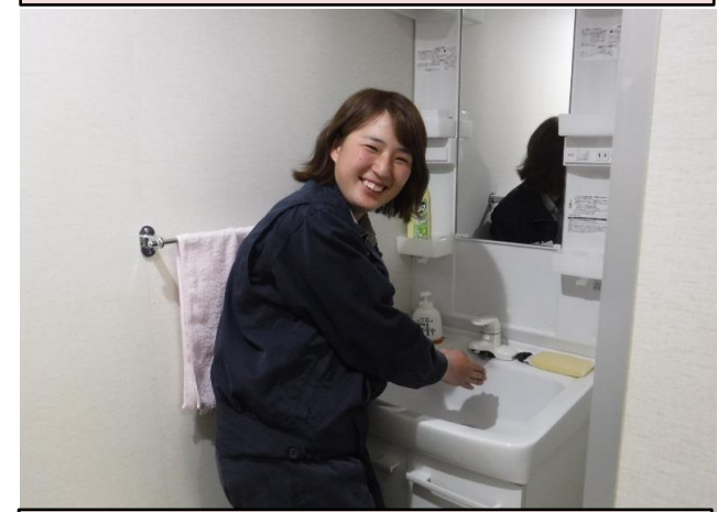
女性用更衣室、洗面所、トイレ整備