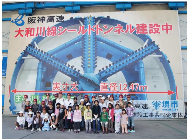
けんせつ小町現場見学