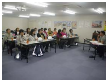
⑤定期的な所内での女性意見交