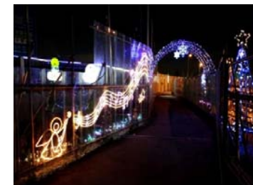
③現場イメージアップ活動