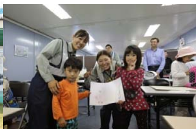
⑦けんせつ小町活躍現場見学会