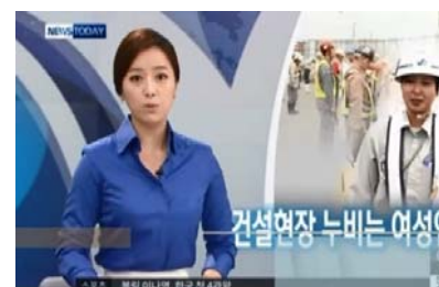
⑧メディア取材対応