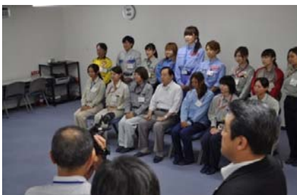
④太田前国交大臣との意見交換