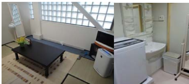
①女性用休憩室、パウダールームの整備