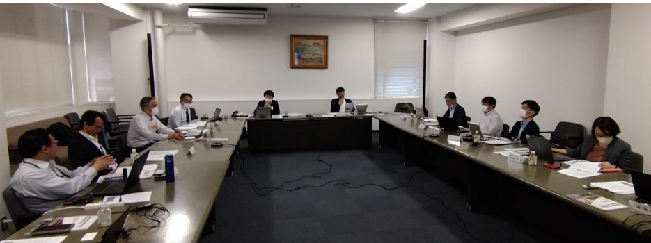
建築BIM合同会議の開催状況