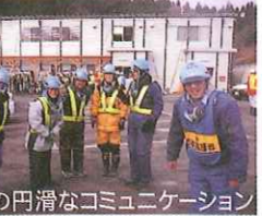
朝礼時の円滑なコミュニケーション