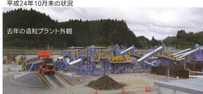
平成24年10月末の状況 去年の造粒プラント外観 平成25年3月の状況 こんなに変わりました

今秋までのリサイクル処理完了を目指し、焼却灰の造粒前処理プラントを改良・増設し造粒処理も昼夜稼働に入りました。