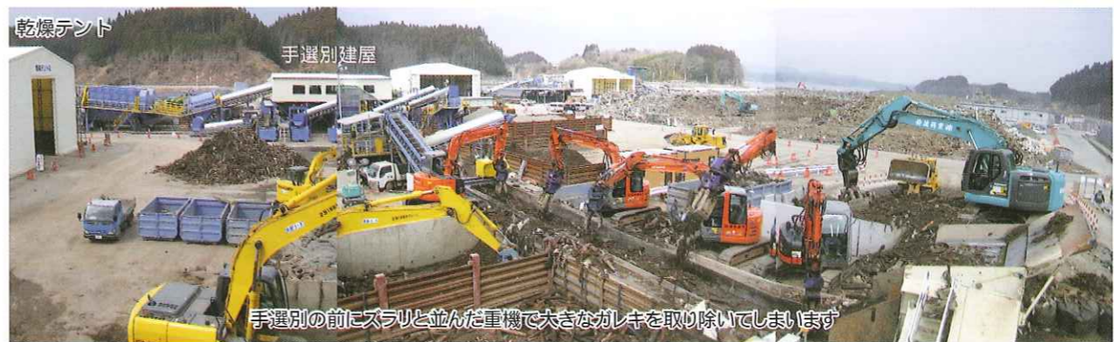
手選別の前にスラリと並んだ重機で大きなガレキを取り除いてしまします

③乾燥テントで乾燥した後手選別へ ②手で分別できない大きなガレキを重機で取り除きます