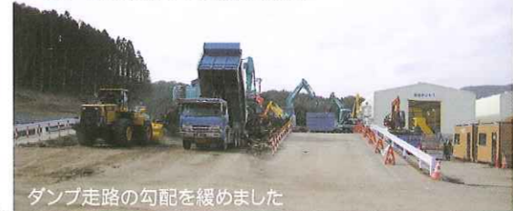
ダンプ走路の勾配を緩めました