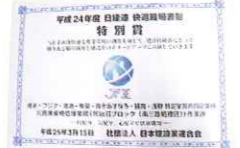
受賞記念プレート