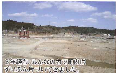
2年経ち、みんなの方で町内はずいぶん片づいてきました。

3・11東日本大震災二周年を迎えて、南三陸町追悼式に合わせて14時46分に作業を全て停め、犠牲者の冥福を祈り全員で『1分間の黙とう』を捧げました。