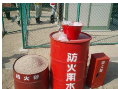
防火用水および包水袋