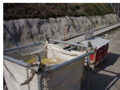
ずり仮置き場補助脚線回収箱