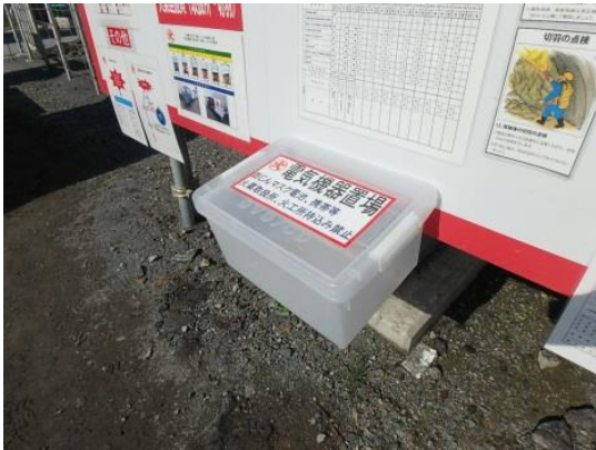
写真-7 電気機器置き場