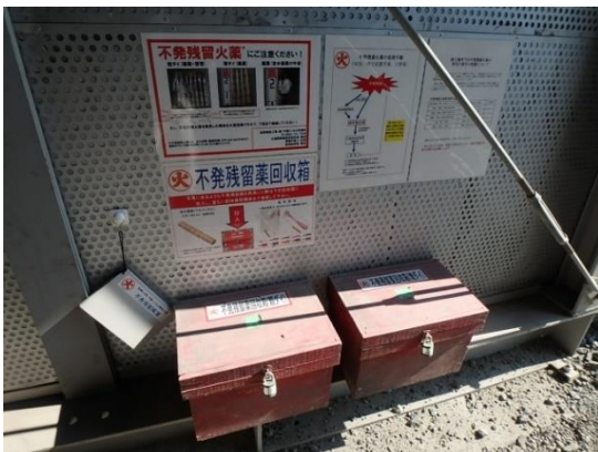
写真-4 残土仮置き場の不発残留対策

残土一次仮置き場の防音ハウス内に、不発残留回収箱と帳簿、不発残留火薬発見時の緊急連絡先処理フローを掲示しています。