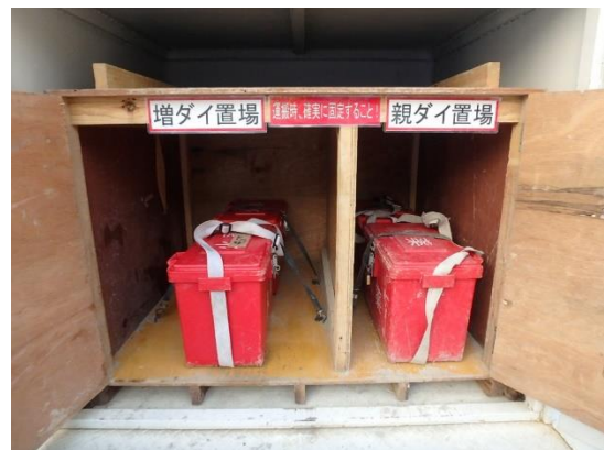
写真-10 動揺防止対策

火薬運搬車の荷台には木製の分別箱を設け、分別箱と火薬運搬箱をゴムバンド結束し、運搬時の動揺が無いようにしています。