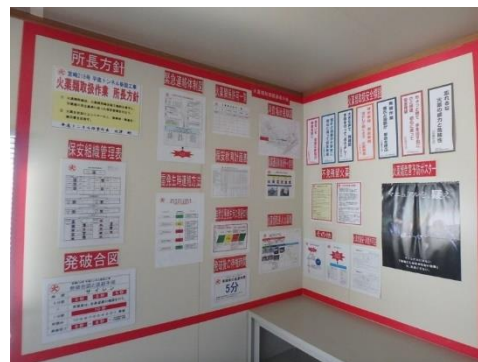
写真-2 火薬管理掲示板(現場事務所)

現場事務所および作業員休憩所、火工所周辺に所長方針や火薬管理体制表等を集約した火薬類掲示板を設置しました。また、人目に付きやすいように掲示板全体を赤囲いする工夫も施しました。