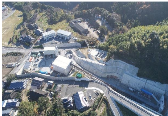
写真-13 坑外ベルトコンベアと防音ハウス

り、工事計画段階から夜間作業時の騒音対策が課題となっていました。そこで、ズリ出し方式をタイヤ方式からベルトコンベア方式に変更し、ズリ集積場所は防音ハウスで囲い、夜間ずり出し時の騒音対策を行いました。