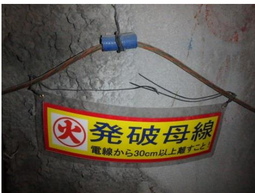
写真-8 発破母線の明示

発破母線には看板を取付けて、一目でわかるようにしています。また、発破母線と電線は30cm以上離隔を取るように明示しています。