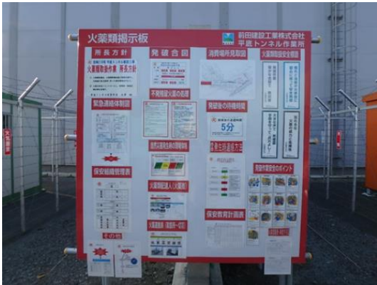
写真-3 火薬管理掲示板(火工所周辺)