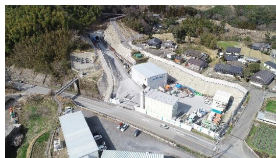
写真-1 仮設ヤード全景