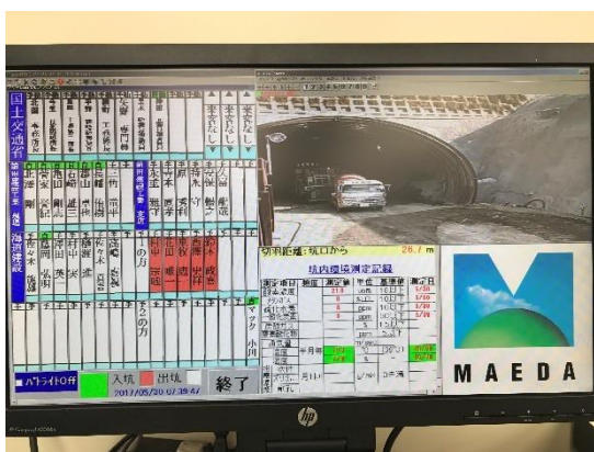
写真-15 web カメラ

切羽、覆工作業箇所 web カメラを設置して、作業所事務所より切羽の施工サイクルや、覆工コンクリート打設数量が把握できるようにしています。これにより、元請け職員が効率的に、事務所での内業と現場での施工管理業務ができるようになりました。