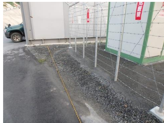
写真-6 保安空地の明示

取扱所・火工所周辺には、トラロープにて保安空地を明示し、車両の駐車や材料を仮置きしないような工夫を施しています。