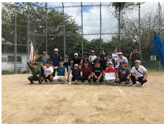
写真-16 地域行事への参加

ソフトボール大会や駅伝大会、地域のお祭りなどに積極的に参加することで、地元の方々との親睦を深めるとともに、地域行事活性化を図っています。なお、昨年8月のソフトボール大会では、地元の方々との混成チームで優勝し、大変盛り上がりました。