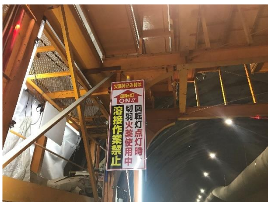
写真-11 溶接作業禁止看板

鋼材の組立にアーク溶接を頻繁に使用します。切羽へ火薬を持ち込んだ際に、防水シート台車に取り付けしたパトライトを火薬運搬員が作動させ、アーク溶接禁止を注意喚起するようにしています。