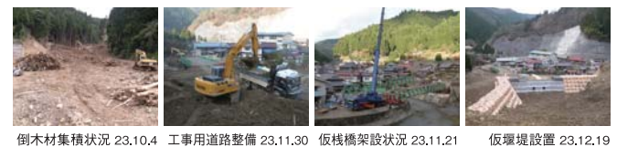
倒木材集積状況 23.10.4 工事用道路整備 23.11.30 仮栈橋架設状況 23.11.21 仮堰堤設置 23.12.19